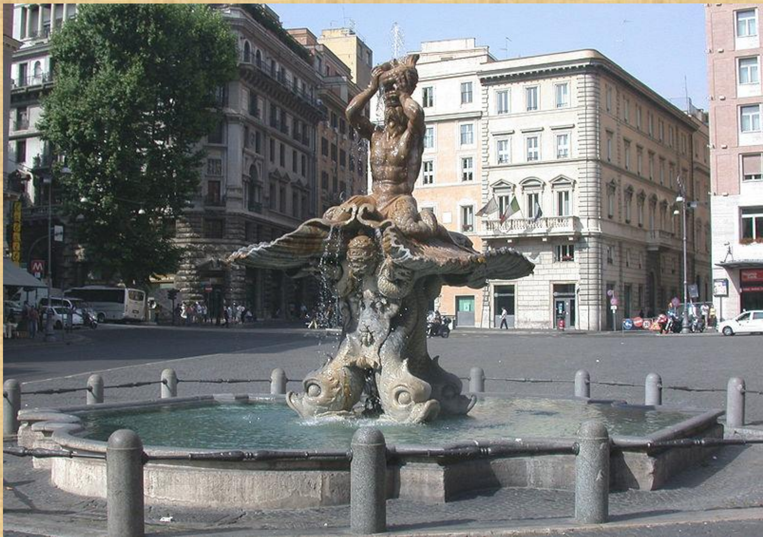
Фонтан Тритона Fontana del Tritone

Страна Италия Местоположение Рим, пiazza Барберини Автор проекта Бернини Строительство 1642 — 1643 годы Состояние действующий фонтан