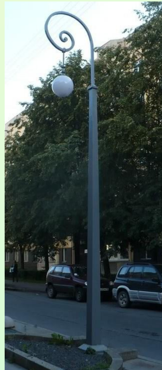
Электрические фонари разных лет