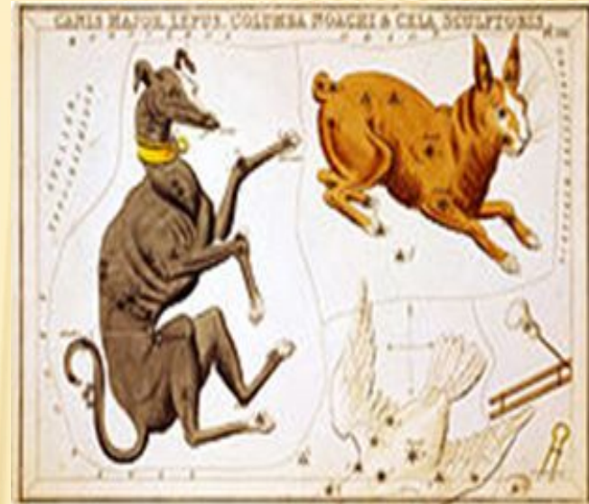
Созвездие Большого Пса