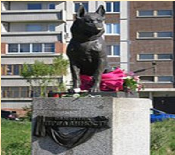
Памятник Преданности, Тольятти, Россия

В благодарность за свою преданность и безупречную службу собаке во многих странах установлены памятники.