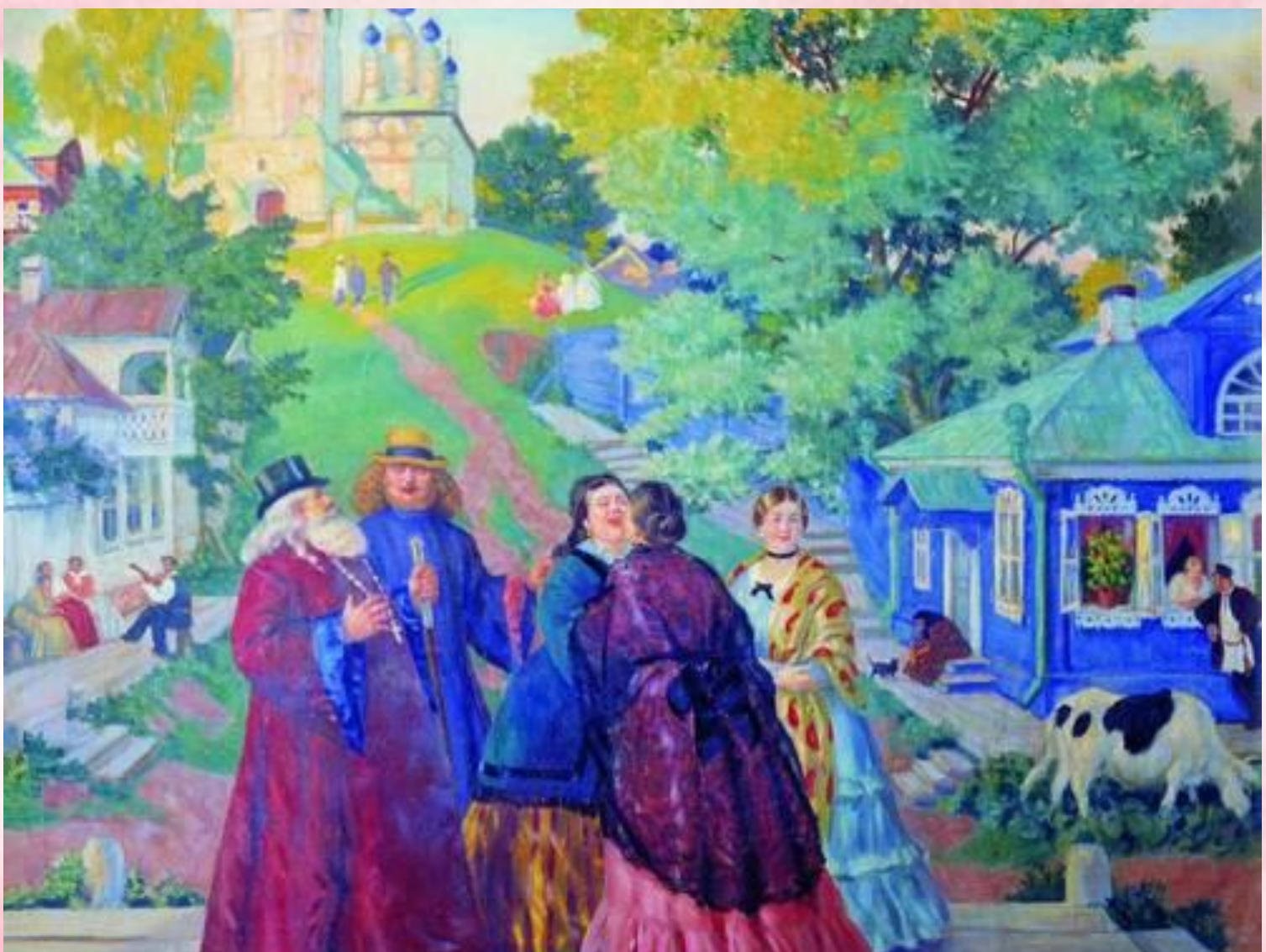
Кустодиев Борис Михайлович. Встреча (Пасхальный день)