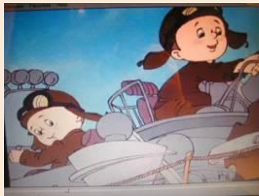
• Винтик и Шпунтик