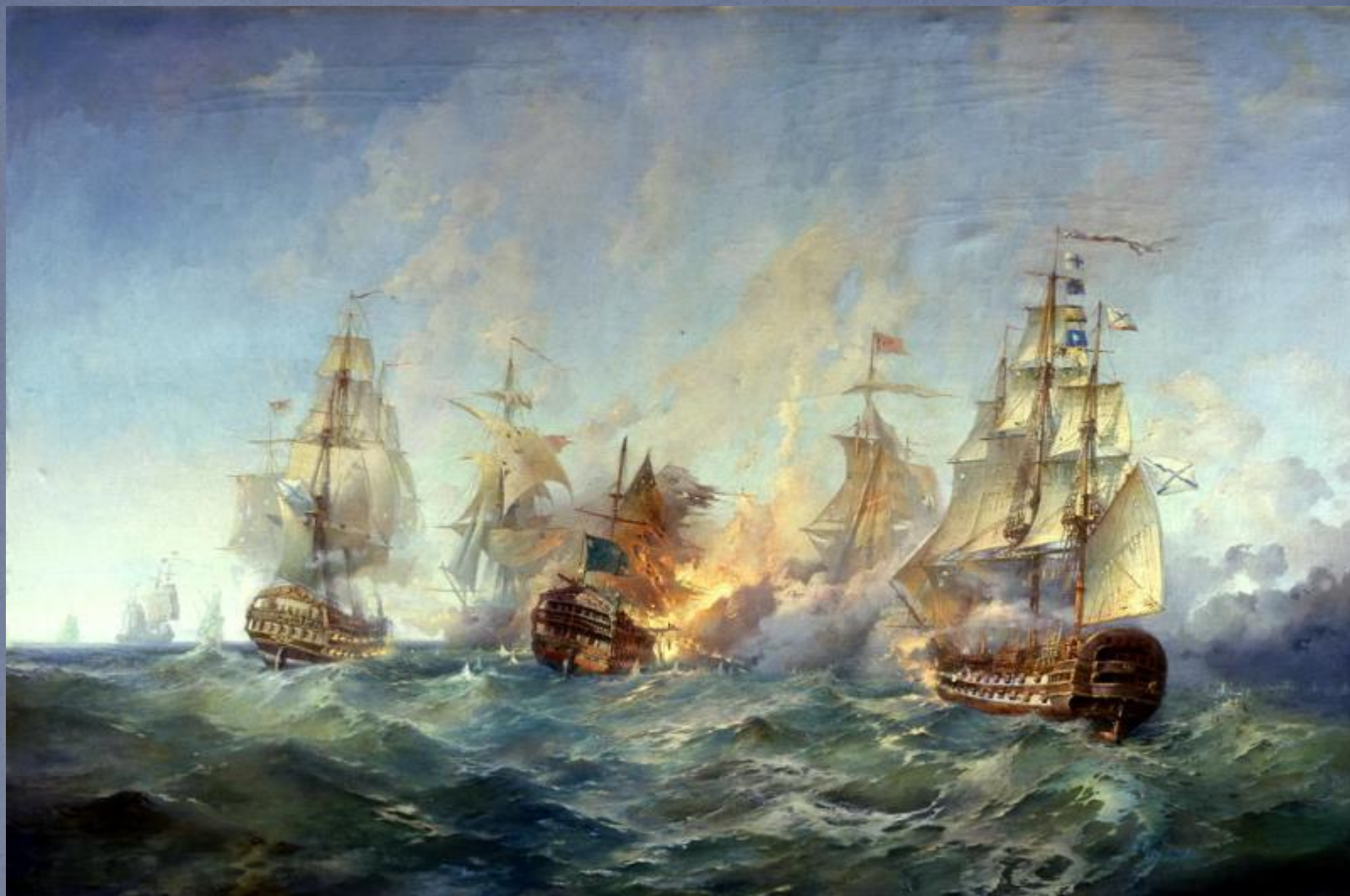
• БЛИНКОВ Александр - Сражение у острова Тендра 28-29 августа 1790 года, 1955