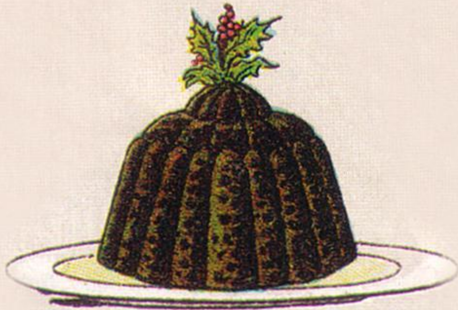
Christmas Plum Pudding.