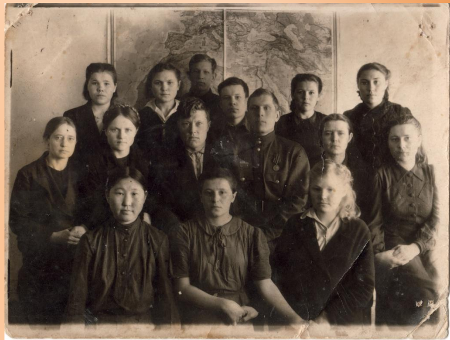
С одноклассницами вечерней школы.

На второй год войны появилась возможность 3 раза в неделю ходить в вечернюю школу. На занятия шли после напряжённого трудового дня. Электричества тогда не было – занимались при свете керосиновых ламп.