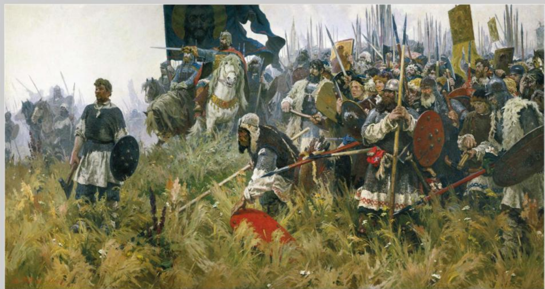
А. Бубнов. Утро на Куликовом поле.

«Куликовская битва принадлежит... к символическим событиям русской истории. Таким событиям суждено возвращение. Разгадка их еще впереди». (А. Блок)