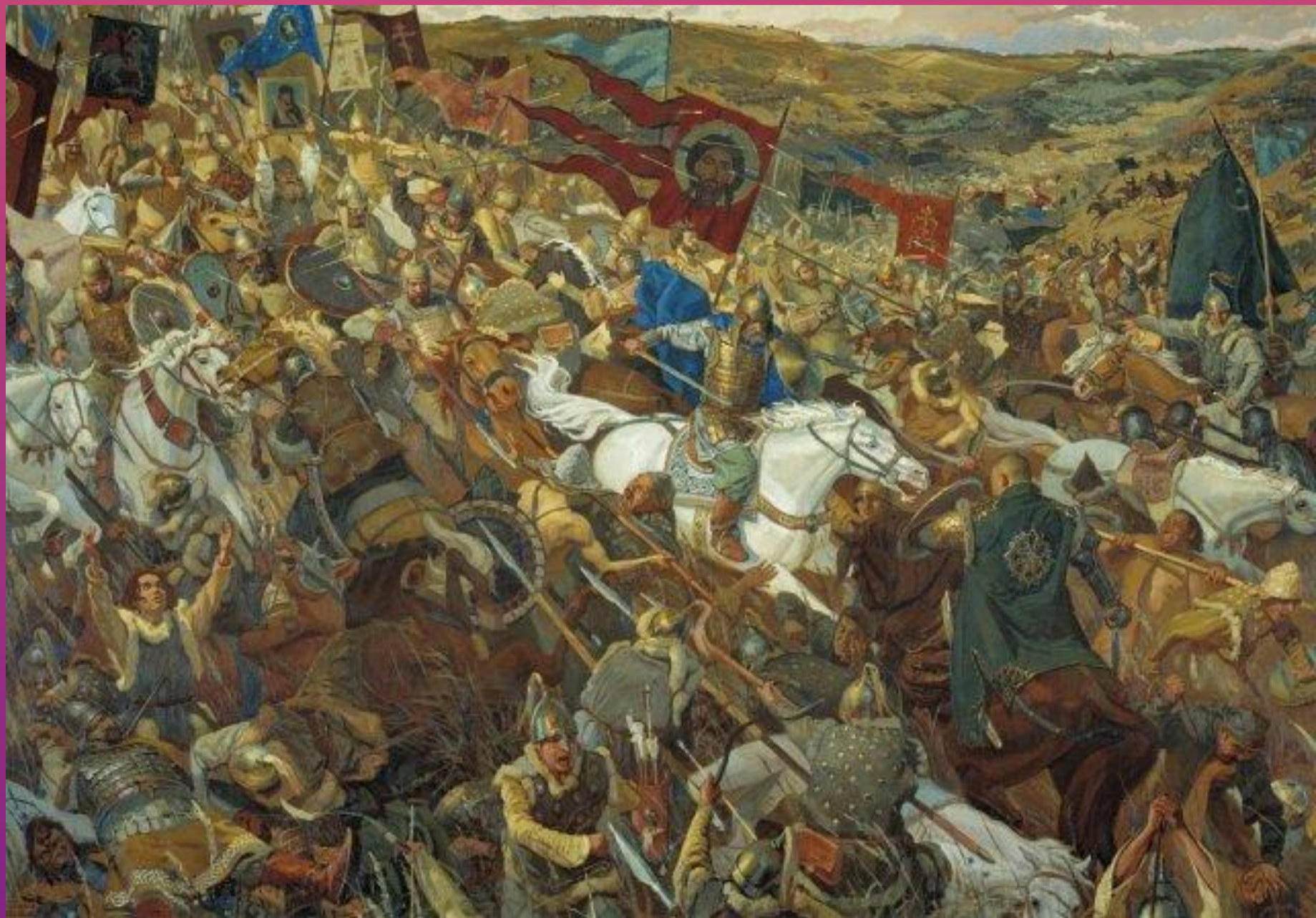
В. Маторин. Удар засадного полка