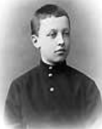
Блок - ребенок в детстве. Февраль 1890.