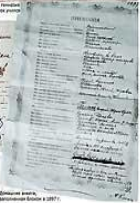
Детские записки, Молодой Блок в 1897 г.