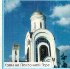
Храм на Поклонной Горе