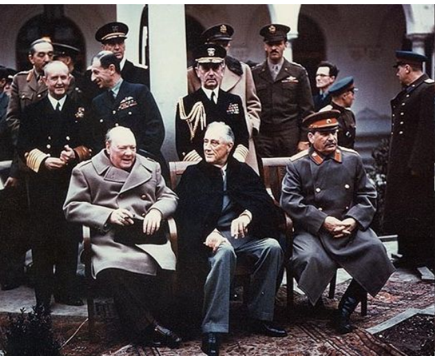
У. Черчилль, Ф.Д. Рузвельт, И. В. Сталин – главы правительств

Согласованы планы разгрома и условий безоговорочной капитуляции Германии