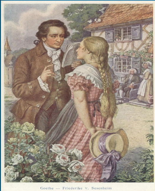
Goethe — Friederike v. Sesenheim