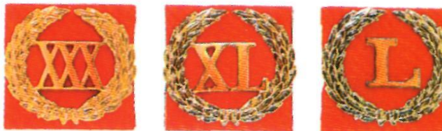
Знак отличия «За безупречную службу» (на ленте ордена «За заслуги перед Отечеством»)

Учрежден Указом Президента РФ от 2 марта 1994 г. № 442 Имеет градации: XV, XX, XXV и XXX лет.