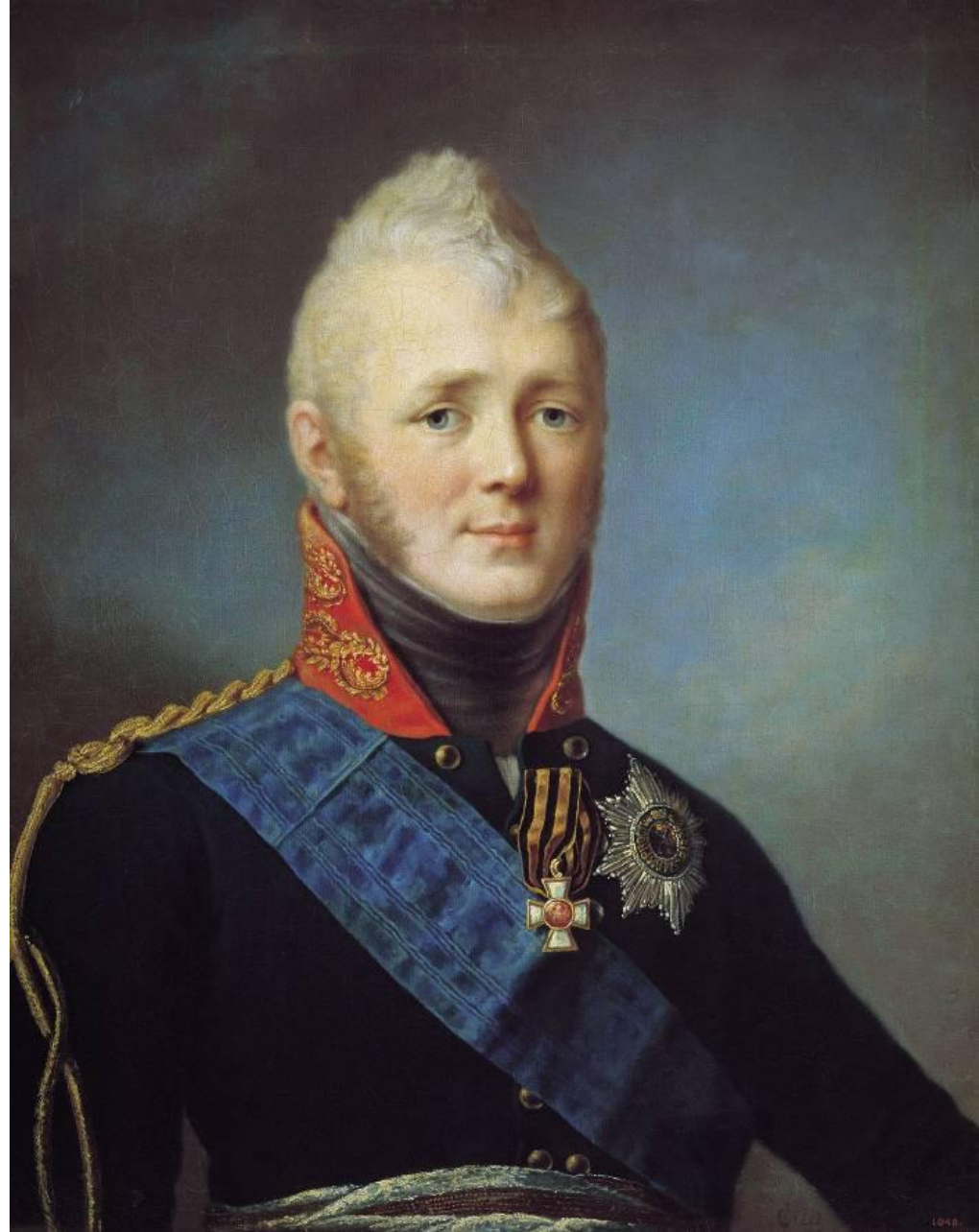
Щукин С.С. Портрет Александра I. начало 1800 - х

Умело лавировал между ними, руководствуясь идеями обоих.