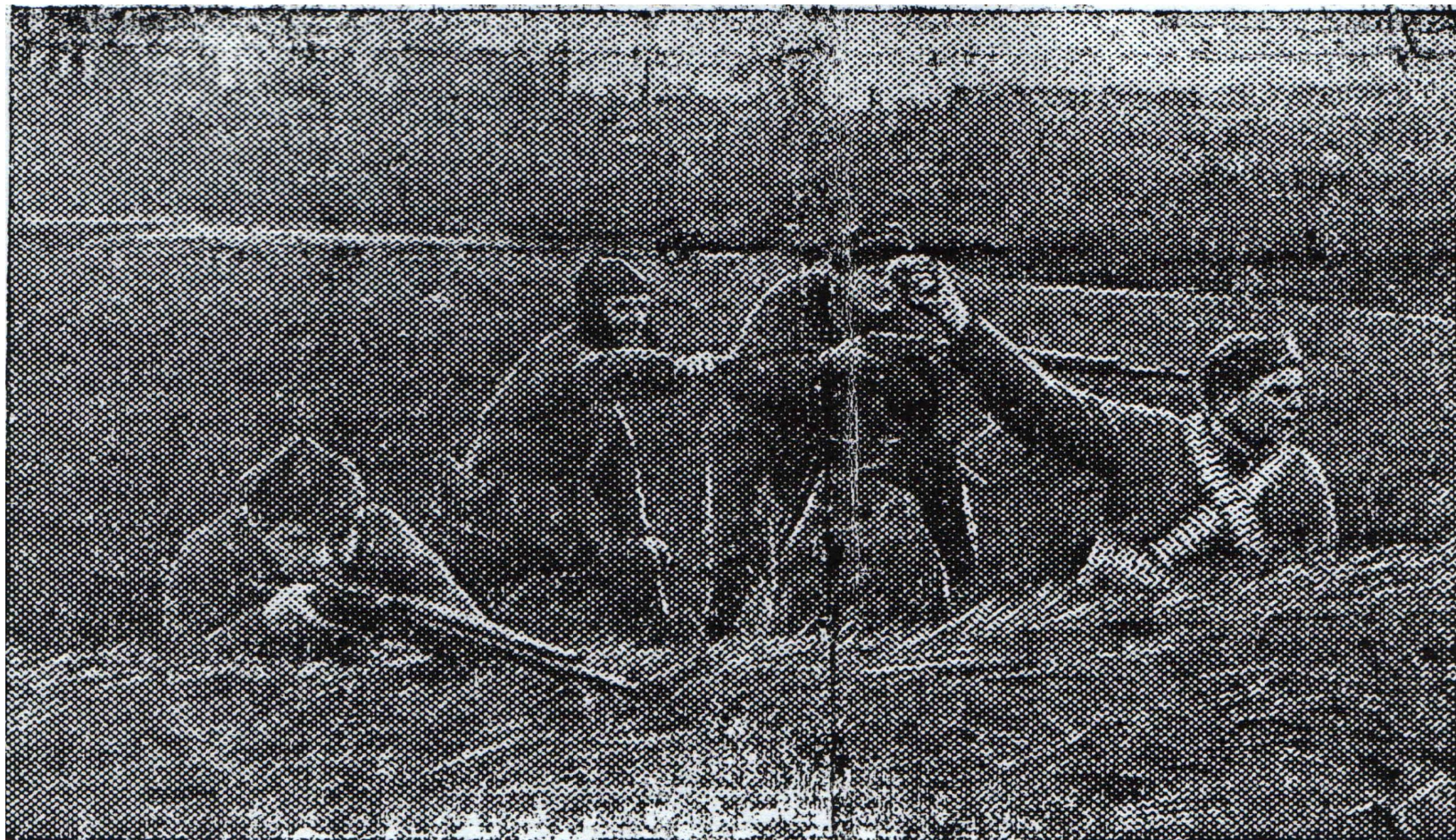
Бойцы истребительного батальона на огневом рубеже

Полки народного ополчения: Ленинский, Сталинский, Кировский, Дзержинский.