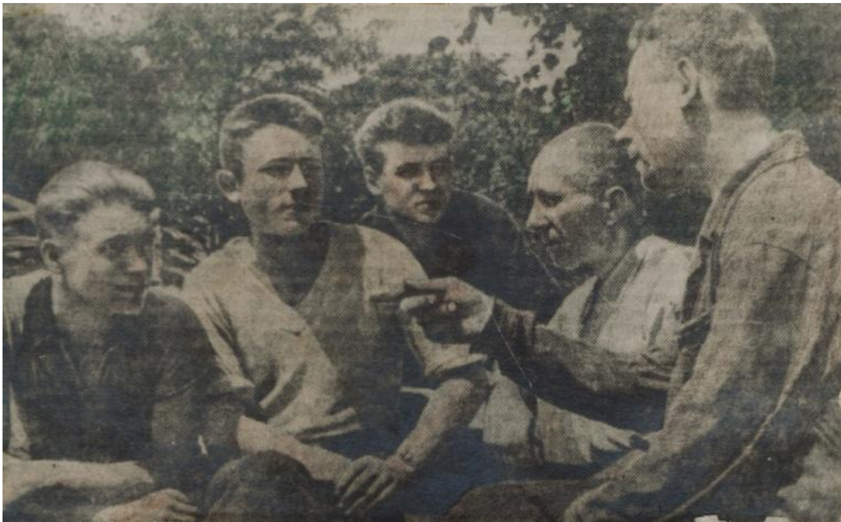
Рабочие обувной фабрики г. Курска записываются в народное ополчение