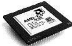
5k86 (166 МГц)