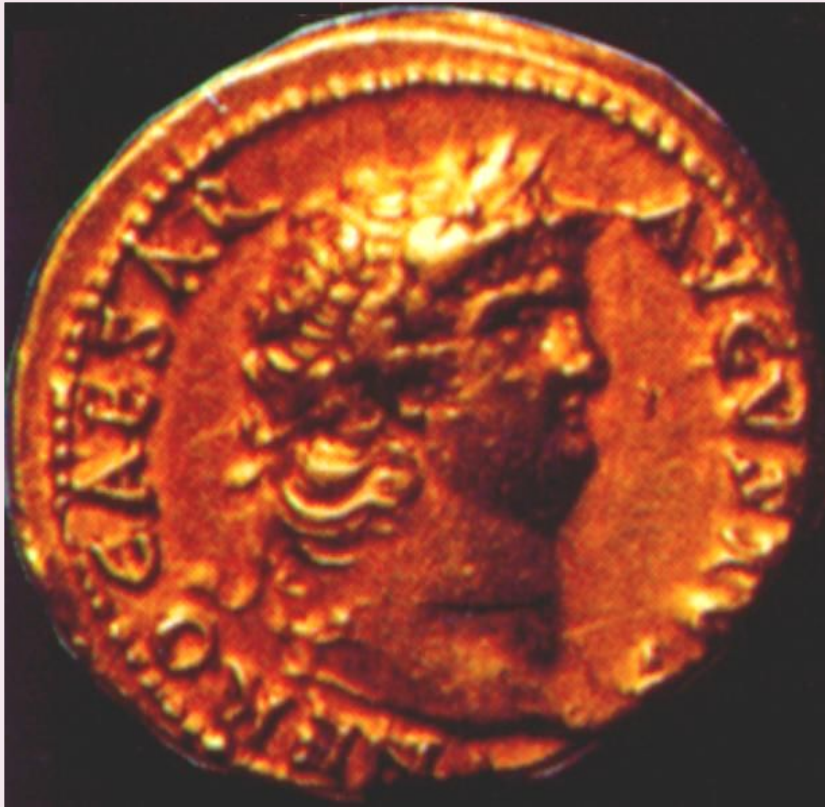
Древнеримская монета с изображением Нерона

Самой зловещей фигурой среди императоров 1-го века н.э. был Нерон.