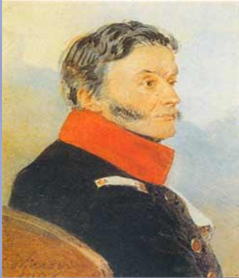
Николай Николаевич Раевский (1771-1829)

Русский полководец, герой Отечественной войны 1812 года, генерал от кавалерии. Участник Бородинского сражения, взятия Парижа и др. сражений.