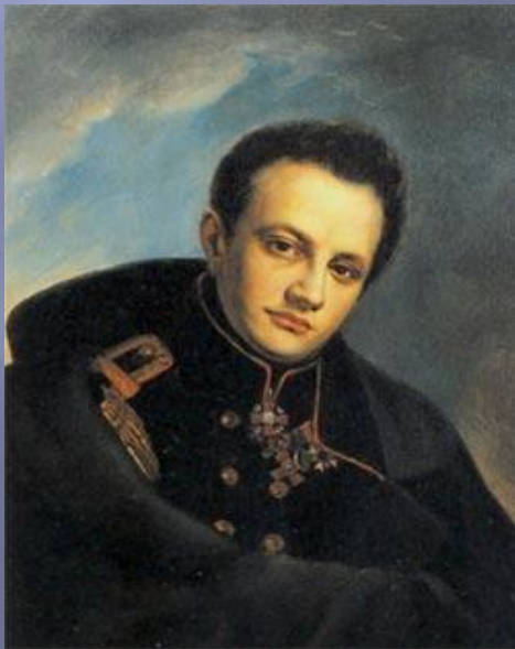
Раевский Александр Николаевич, старший сын (1795-1868).

Русский полководец, герой Отечественной войны 1812 года, генерал от кавалерии. Участник Бородинского сражения, взятия Парижа и др. сражений.