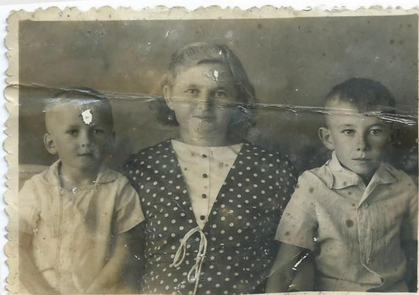
Жена с сыновьями