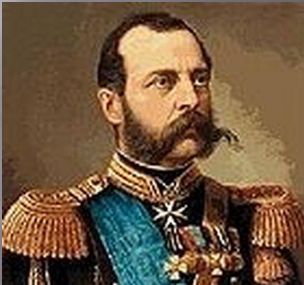
Александр 2 Освободитель