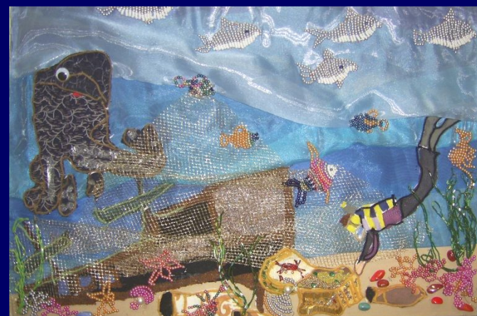
Триптих «Человек и море» выполнен учащимися вторых классов в ходе реализации проекта «В мире природы» по аналогичной схеме. 2009 г.