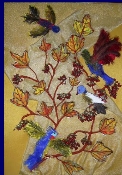
Квадриптих «Времена года»