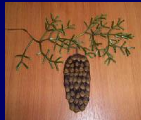
Образцы работы учащихся 2 В класса