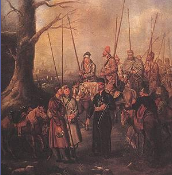
Партизаны. Неизвестный художник. 1-я половина XIX в.

Одним из выдающихся подвигов Давыдова за это время было дело под Ляховым, где он вместе с другими партизанами взял в плен двухтысячный отряд генерала Ожеро; затем под г. Копысь он уничтожил французское кавалерийское депо, рассеял неприятельский отряд под Бельничами и, продолжая поиски до Немана, занял Гродно.