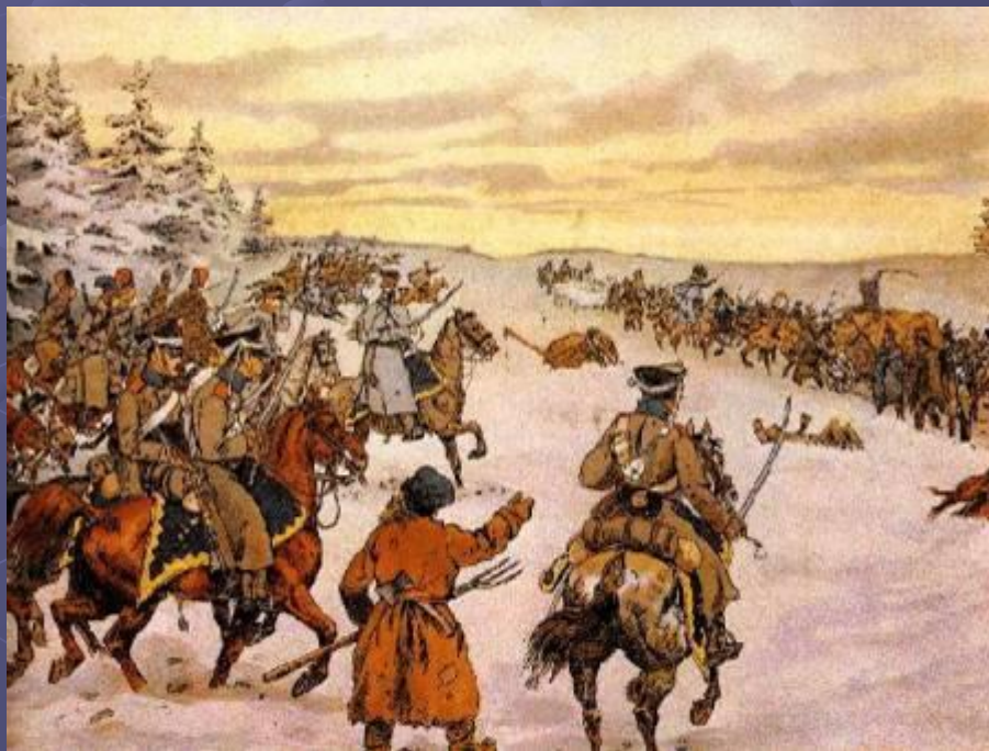
Нападение партизан отряда И. С. Дорохова на французский обоз в районе Перхушкова. Хромофотография