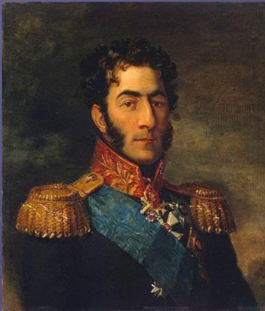
Пётр Иванович Багратион

В 1806-1807 годах Денис Давыдов храбро сражался с французами в Пруссии в чине поручика лейб-гвардии гусарского полка, был адъютантом Петра Ивановича Багратиона.