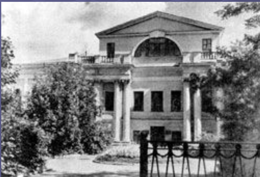
Дом Дениса Давыдова. г. Москва