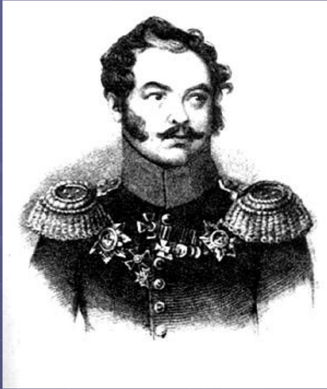
Гравюра на стали с оригинала неизвестного художника. Портрет из издания "Сто русских литераторов".

Денис Васильевич Давыдов находился на военной службе до 1832 года , принимал участие в различных военных кампаниях, был награждён орденами Св. Анны 1-й ст., Владимира 2-й ст., Георгия 4-го кл.; прусским Пур ле Мерит; знаком отличия «За Военное Достоинство» 2-й ст., крестом за Эйлау, золотой саблей с надписью «За храбрость».