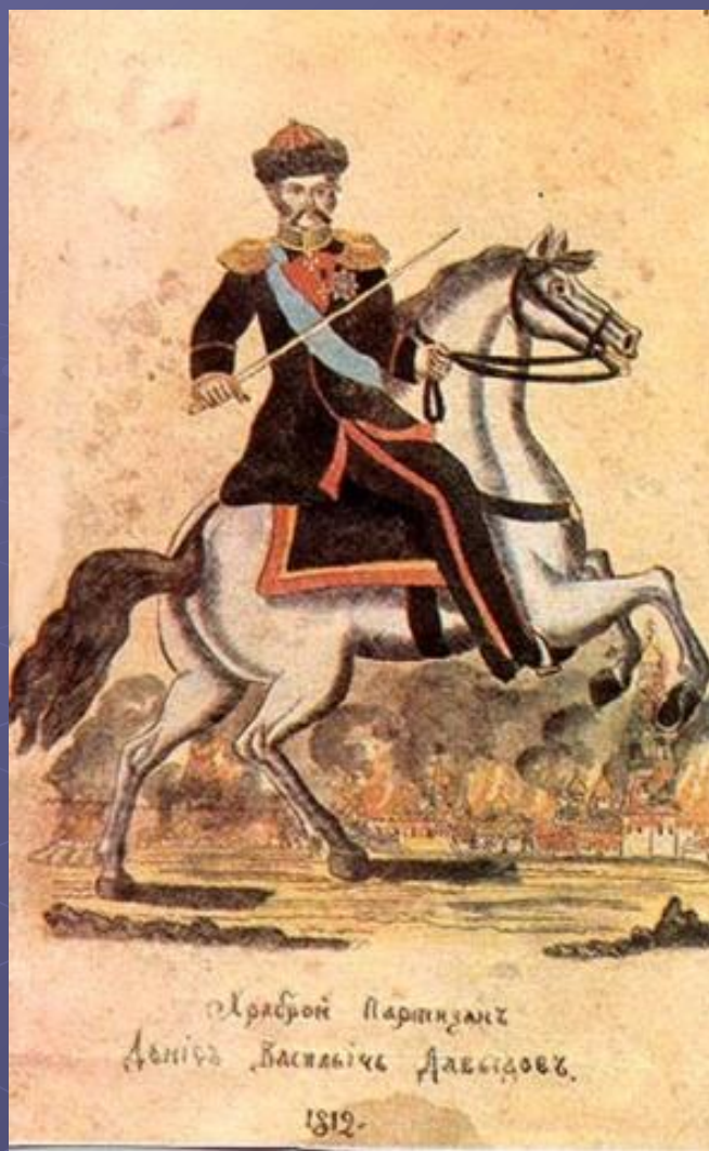
Народный лубок "Храбрый партизан Денис Васильевич Давыдов". 1812 г."