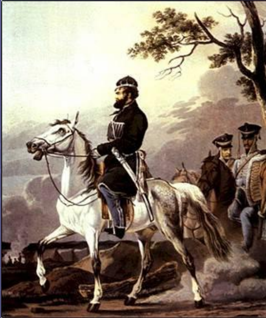
Д.В. Давыдов. Раскрашенная гравюра М. Дюбурга по оригиналу А. Орловского. 1814 г.