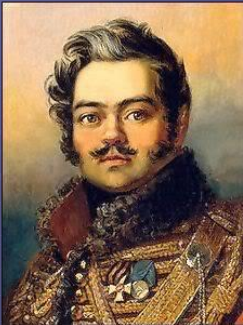
Денис Давыдов в мундире Ахтырского гусарского полка. Портрет кисти Д. Доу