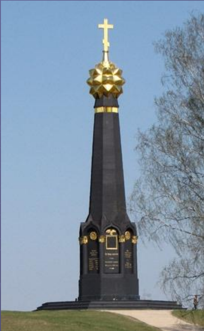
Главный монумент русским воинам, героям Бородинского сражения.

Незадолго до своей кончины Д. В. Давыдов ходатайствовал о перезахоронении своего начальника П. И. Багратиона на Бородинском поле, что и было исполнено по Высочайшей воле государя-императора Николая I-го после смерти Дениса Васильевича. У подножия монумента были захоронены останки князя Петра Ивановича Багратиона, перенесенные сюда по указу императора из села Сима Юрьев-Польского уезда Владимирской губернии, где в имении своих родственников князей Голицыных первоначально был погребен известный полководец, скончавшийся от ран, полученных в Бородинском сражении.