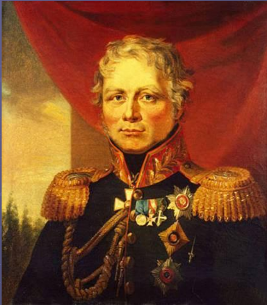
Генерал Фердинанд Фёдорович Винцингероде

С переходом границы Давыдов поступил в корпус генерала Винцингероде, участвовал в поражении саксонцев под Калишем и, вступив в Саксонию с передовым отрядом, занял предместье Дрездена.