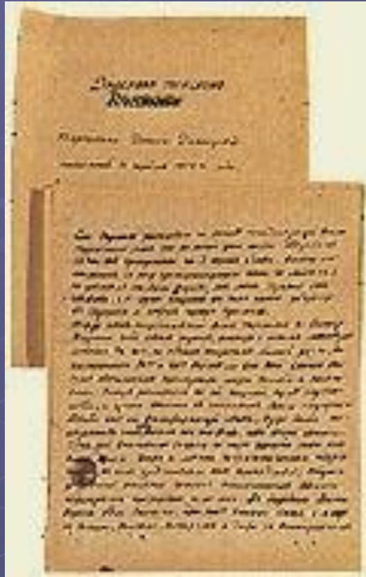
Денис Васильевич Давыдов Дневник партизанских действий

Наиболее интересны сочинения Давыдова: “Опыт теории партизанского действия” (1821), “Встреча с великим Суворовым” (1835), “Мороз ли истребил французскую армию в 1812 году?” (1835), “Дневник партизанских действий” (изд. 1860). В записках Давыдова содержится богатый фактический материал, интересные характеристики А.В. Суворова, М.И. Кутузова, А.П. Ермолова, П.И. Багратиона и др. Поэзия Давыдова отмечена мотивами свободомыслия.