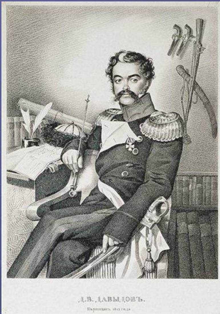
Д. В. ДАВЫДОВЪ.