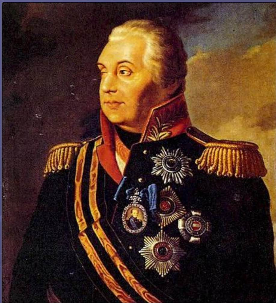
М. И. Кутузов.