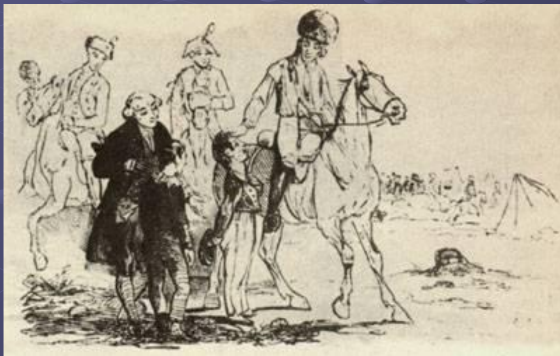
Представление юного Дениса Давыдова А. В. Суворову. Рис. А. Коцебу.