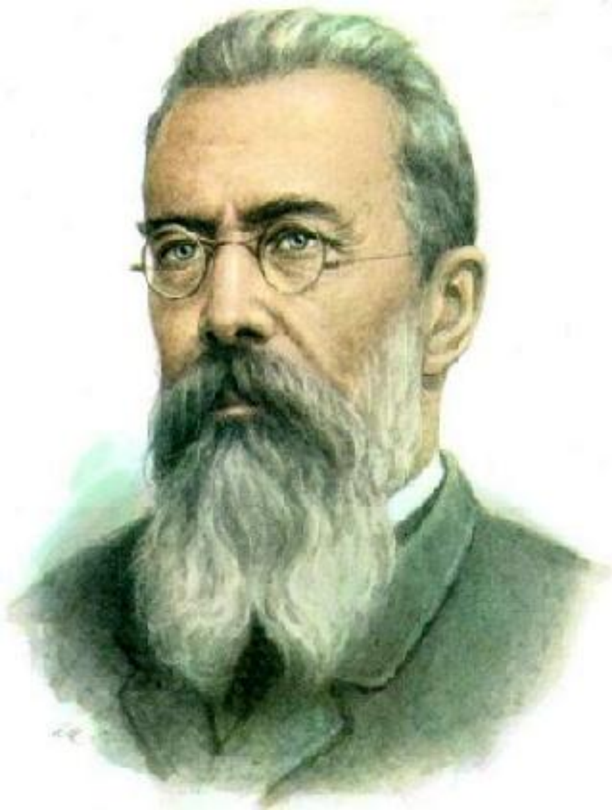
Николай Андреевич Римский Корсаков