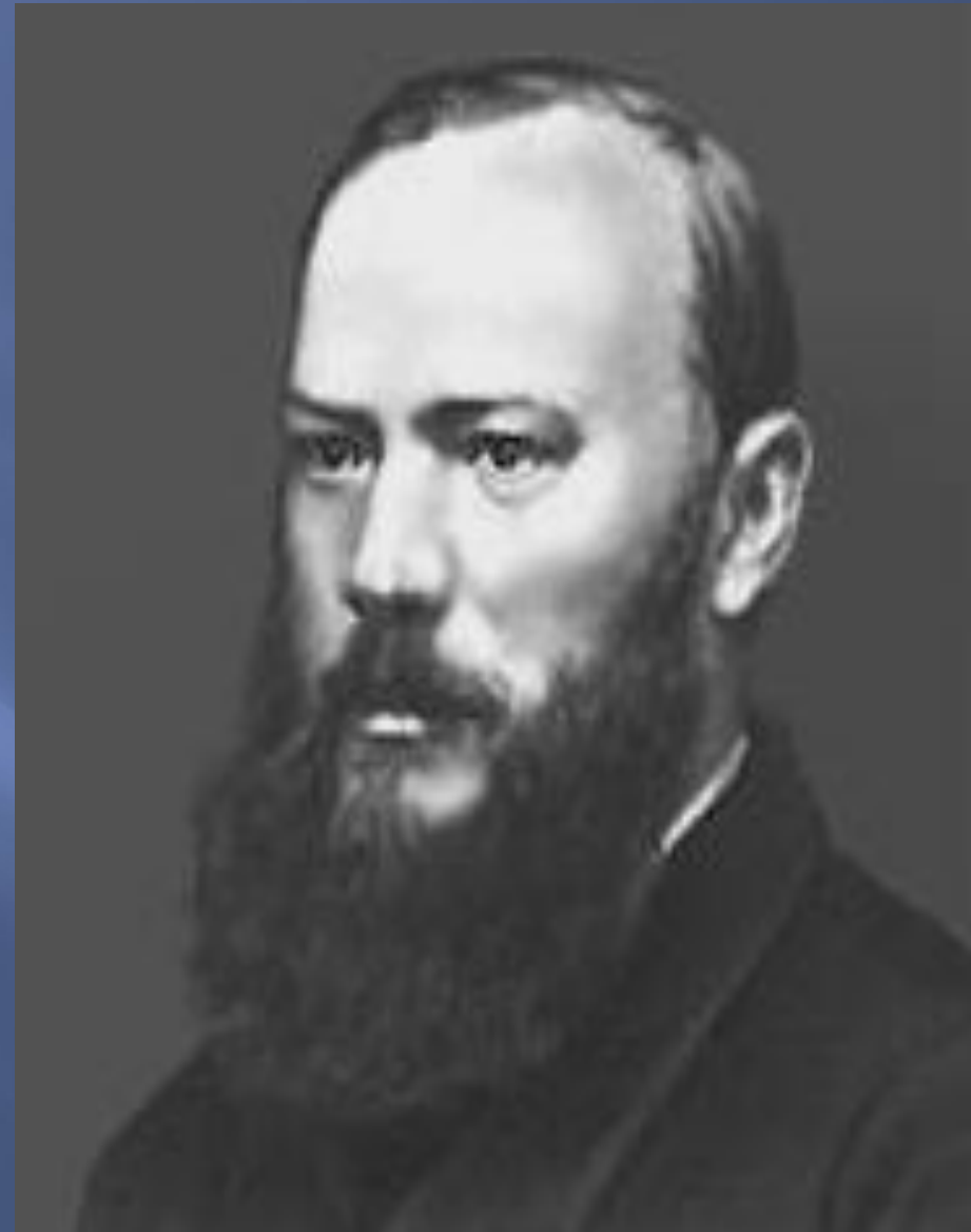
Александр Николаевич Островский