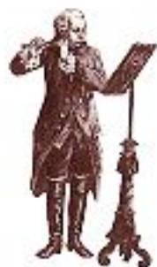
Флейтист 18 века.

Ф лейта является духовым инструментом. Большинство флейт сделаны из металла (обычно из серебра); современные флейты только в виде исключения изготавливают из дерева. Флейту можно использовать в оркестре, ансамблях духовых инструментов, джаз-бэндах, благодаря яркому, ясному звучанию. На флейте играют, вдвывая воздух поперек отверстия для губ. Не считая пикколо, флейта является единственным инструментом в оркестре, на котором играют таким образом.