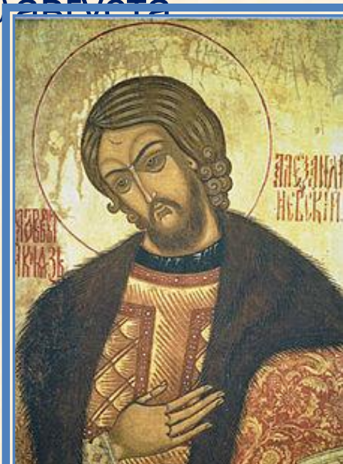
Икона Святого благоверного