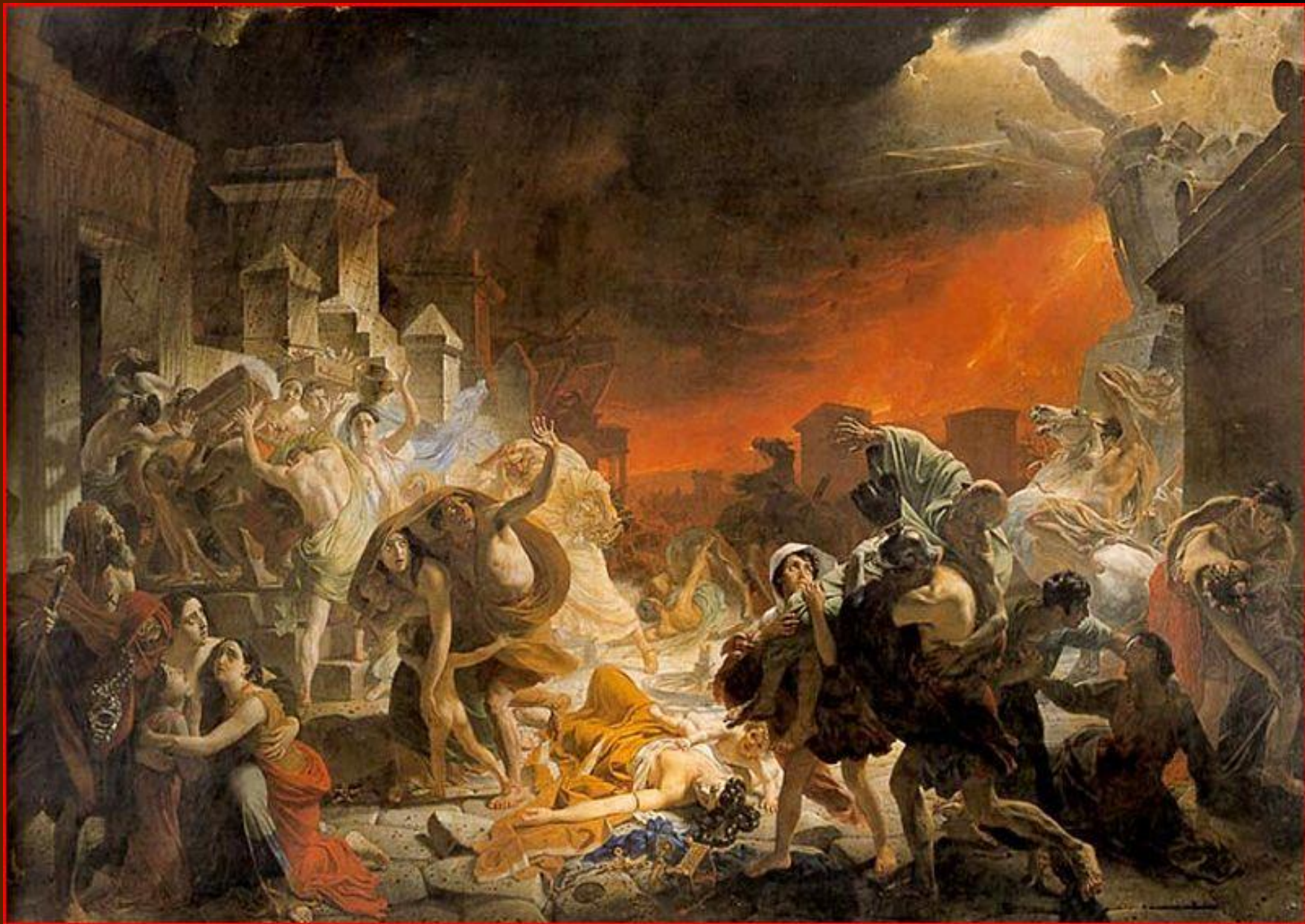
Последний день Помпеи (1830-1833 гг.)