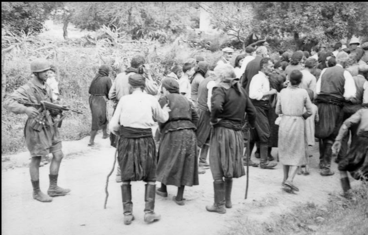
2. Juni 1941