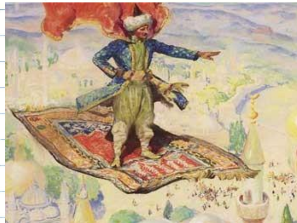
Ковер – самолёт