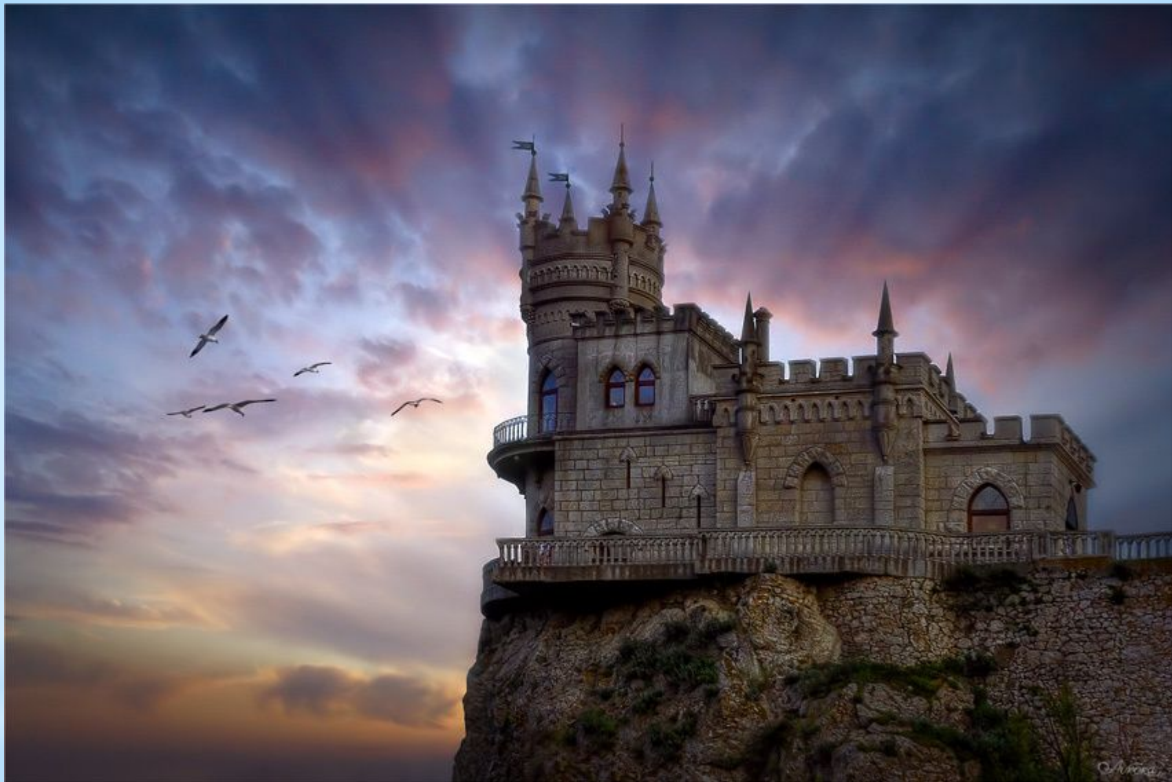
Крым. Ласточкино гнездо.