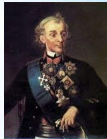
А. В. Суворов

8 апреля 1783 года Екатерина II издала манифест о принятии "полуострова Крымского", а также Кубанской стороны в состав России.