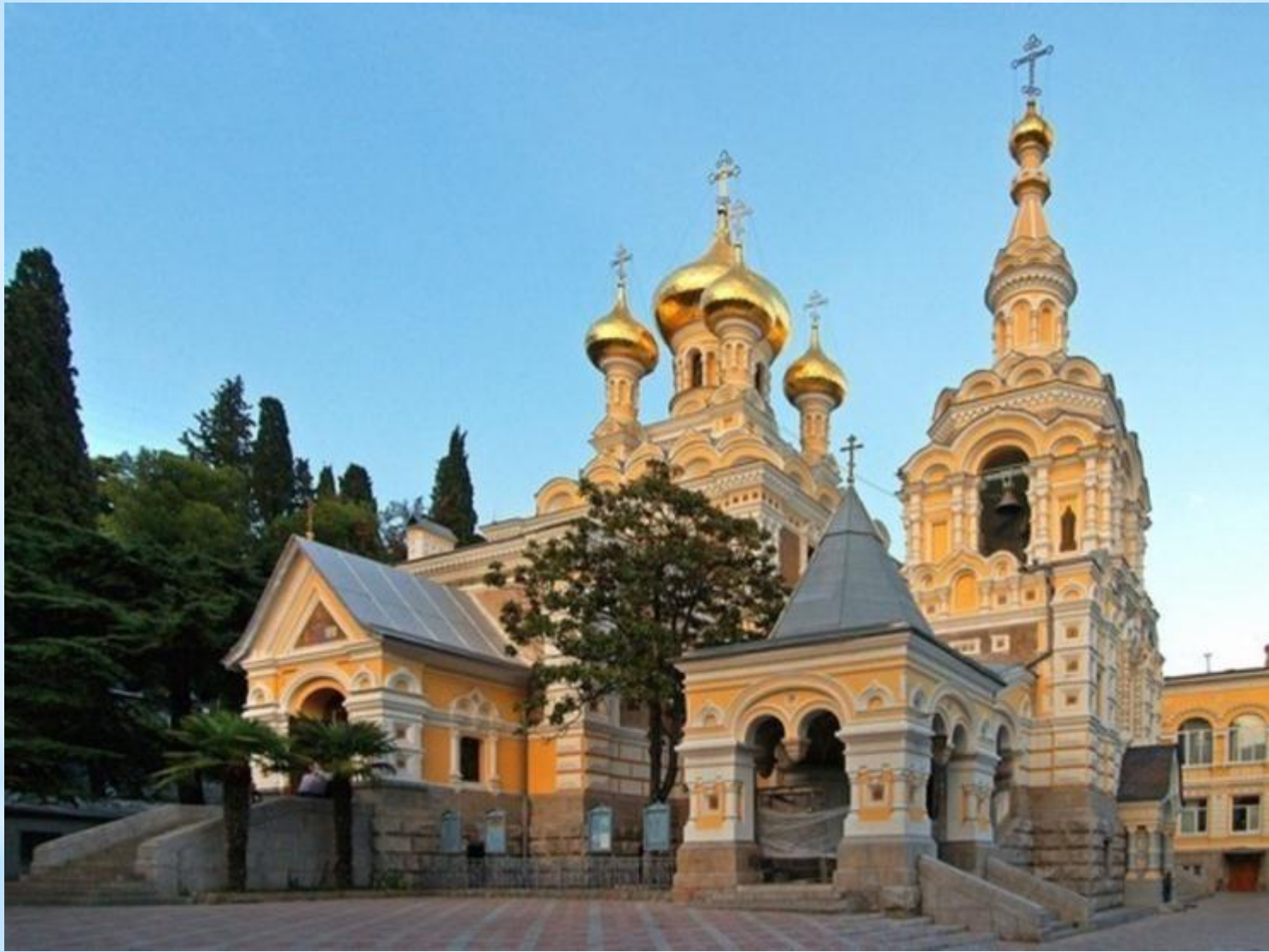
Собор Святого Александра Невского