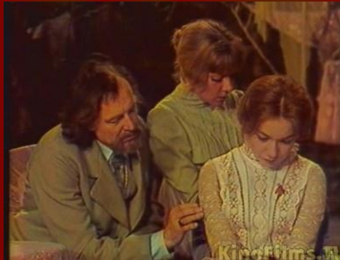
Фильм «Вишневый сад»