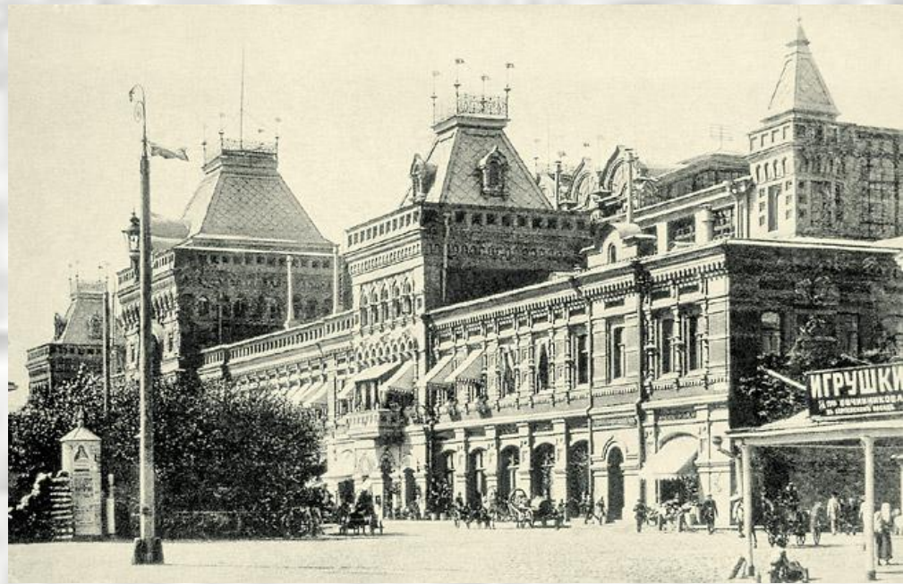
Нижний-Новгородъ.—Nijni-Novgorod. № 10. Ярмарочные Китайскіе ряды въ половинѣ.