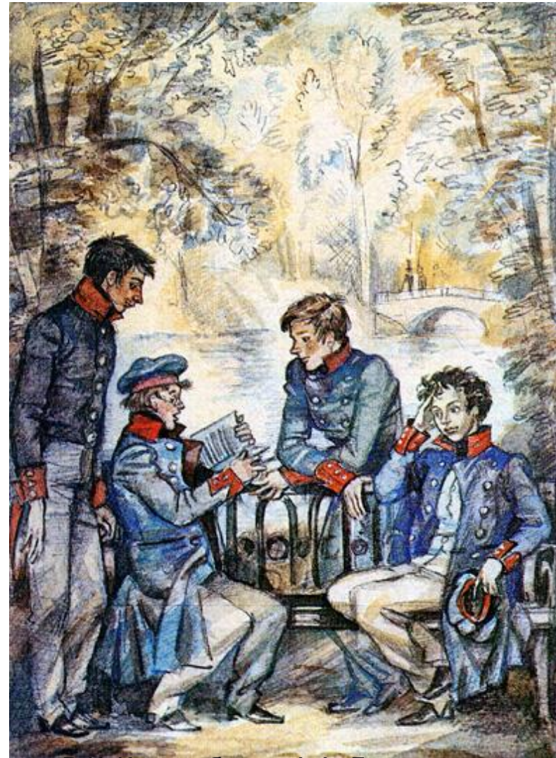
В.К. Кюхельбекер, А.А. Дельвиг, И.И. Пуцин, А.С. Пушкин.