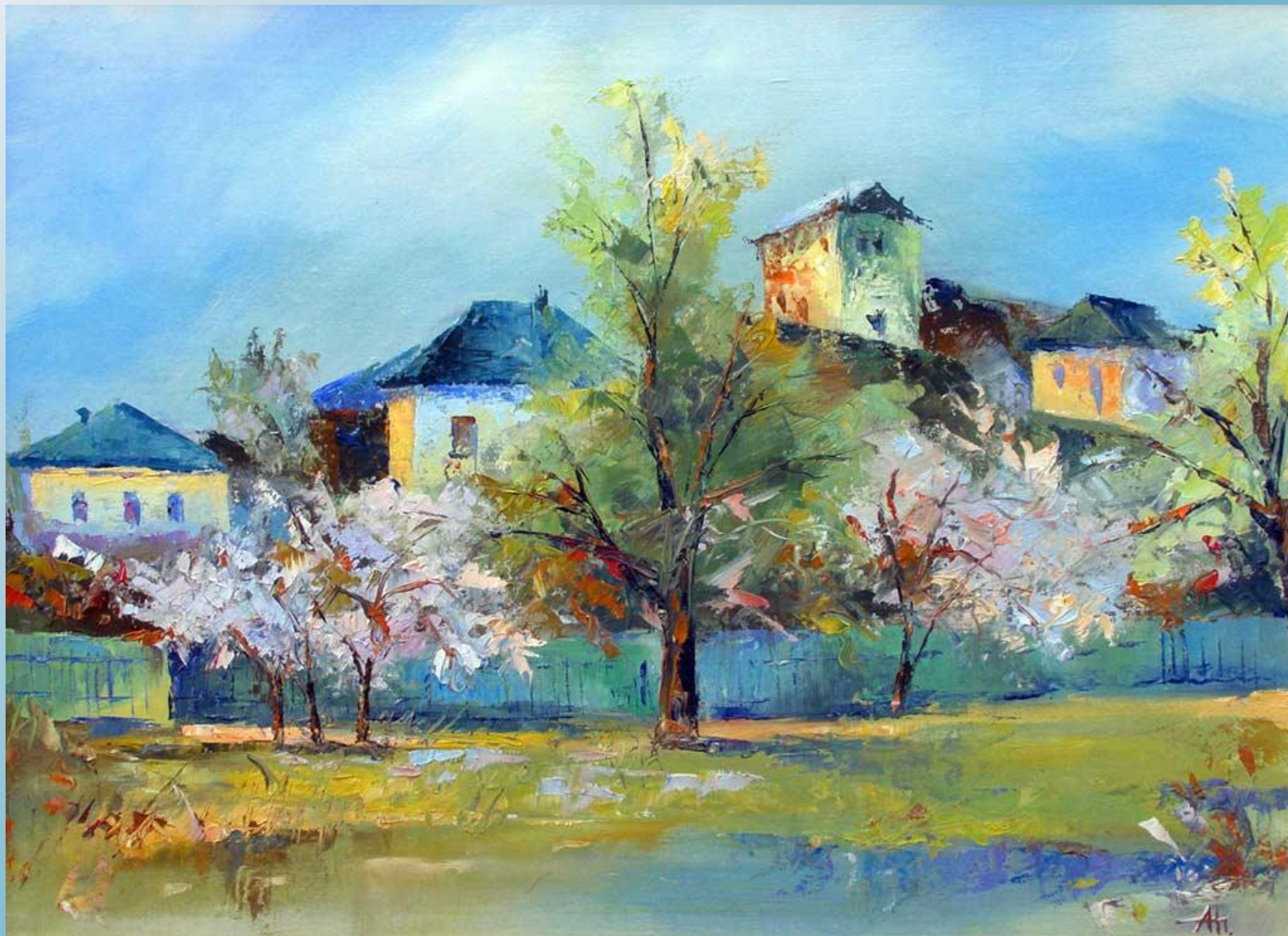
Александр Полунин. Весна.