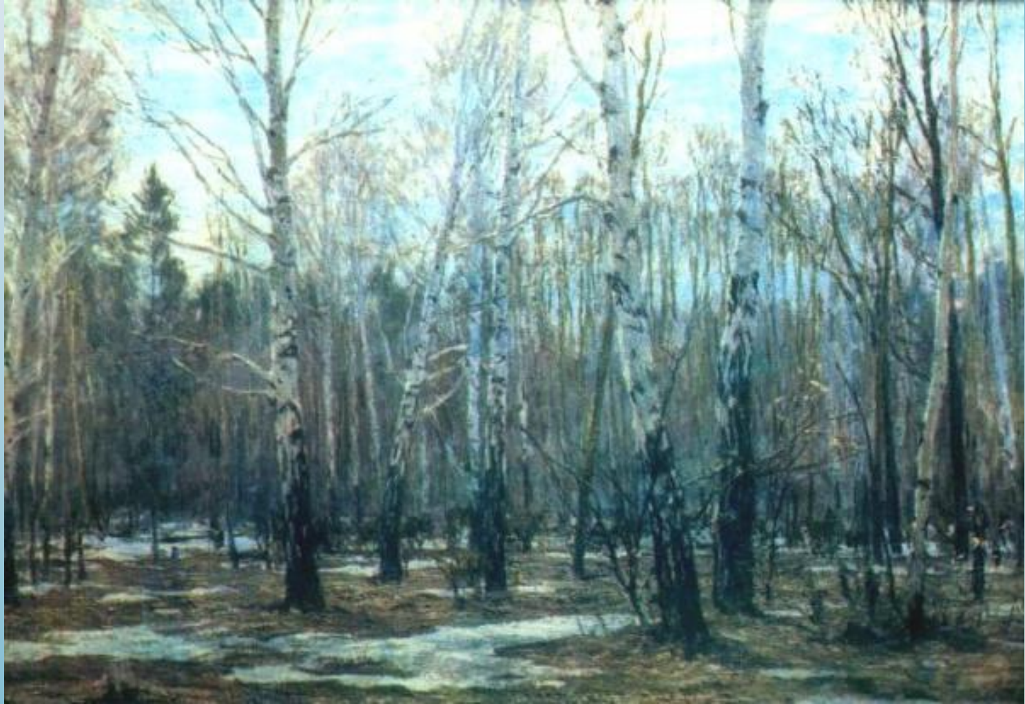
Грицай А.М. Апрель в лесу. Снег сходит.