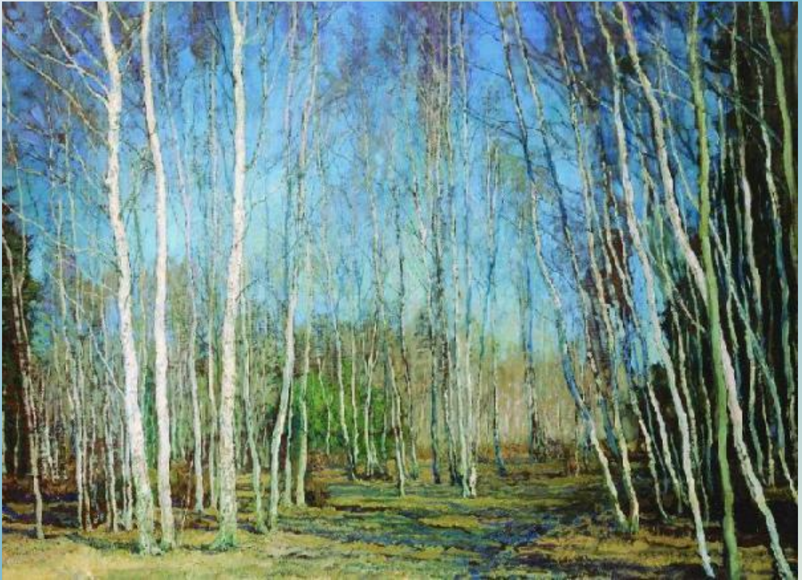
Бакшеев Н.В. Голубая весна.