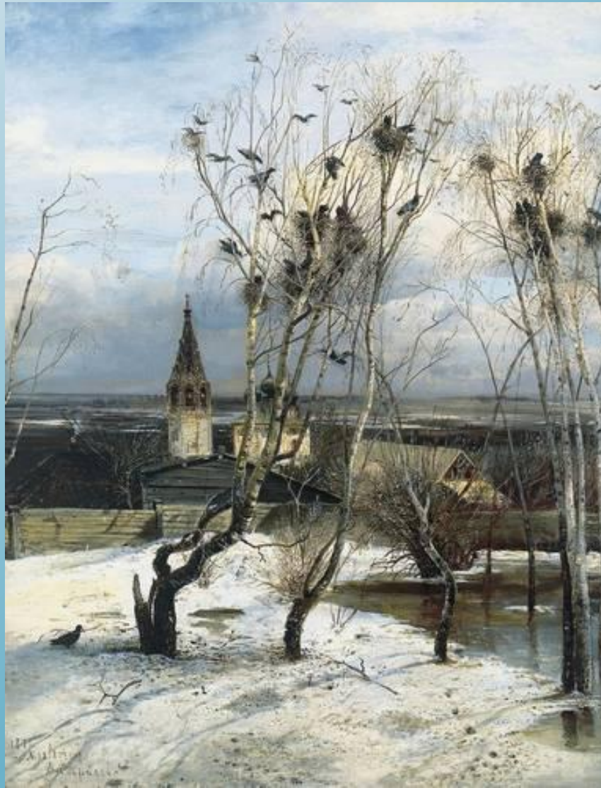
Саврасов А.К. Грачи прилетели.