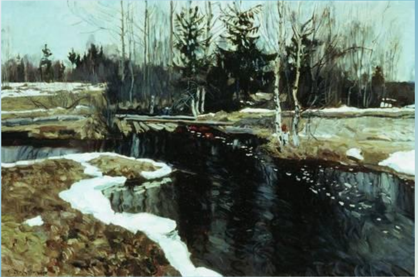
Жуковский С.Ю. Бурлящий весенний ручей.