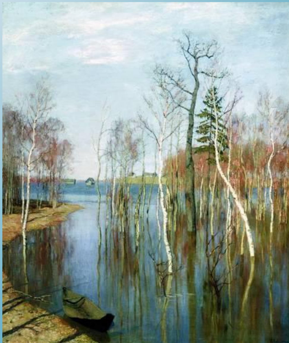
Левитан И.И Весна.Большая вода.