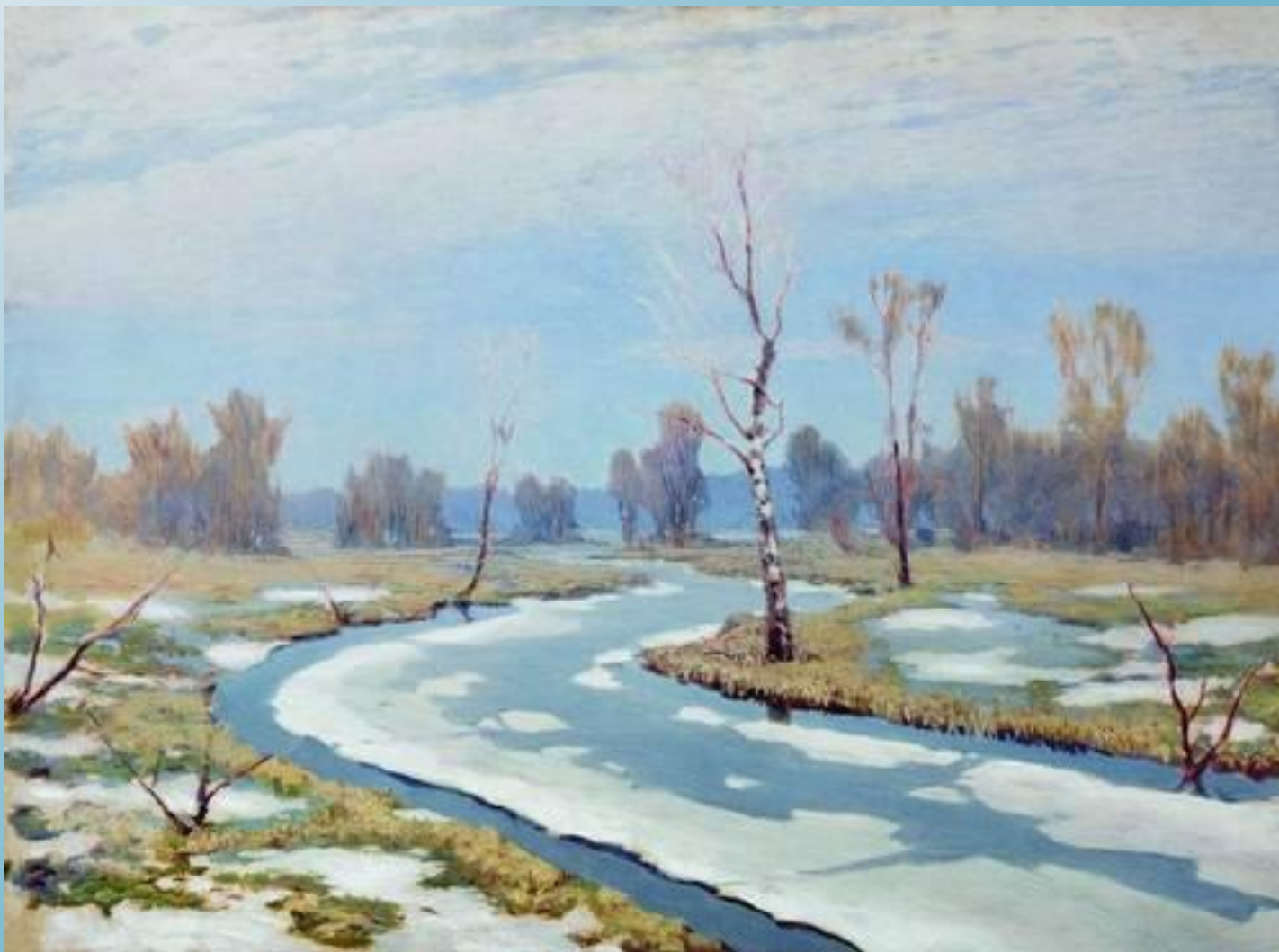
Куинджи А.И. Ранняя весна.