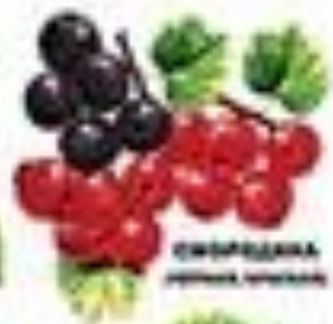
Смородина, красная, черная