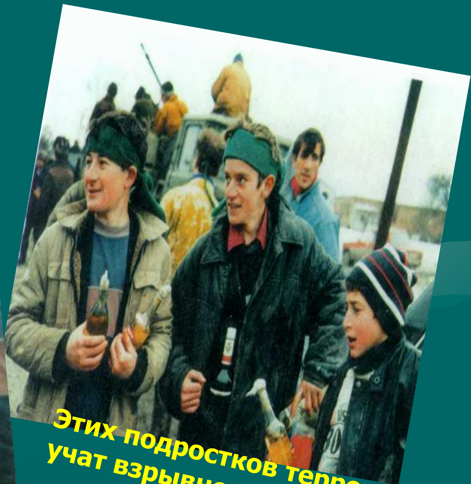
Этих подростков террористы учат взрывному делу