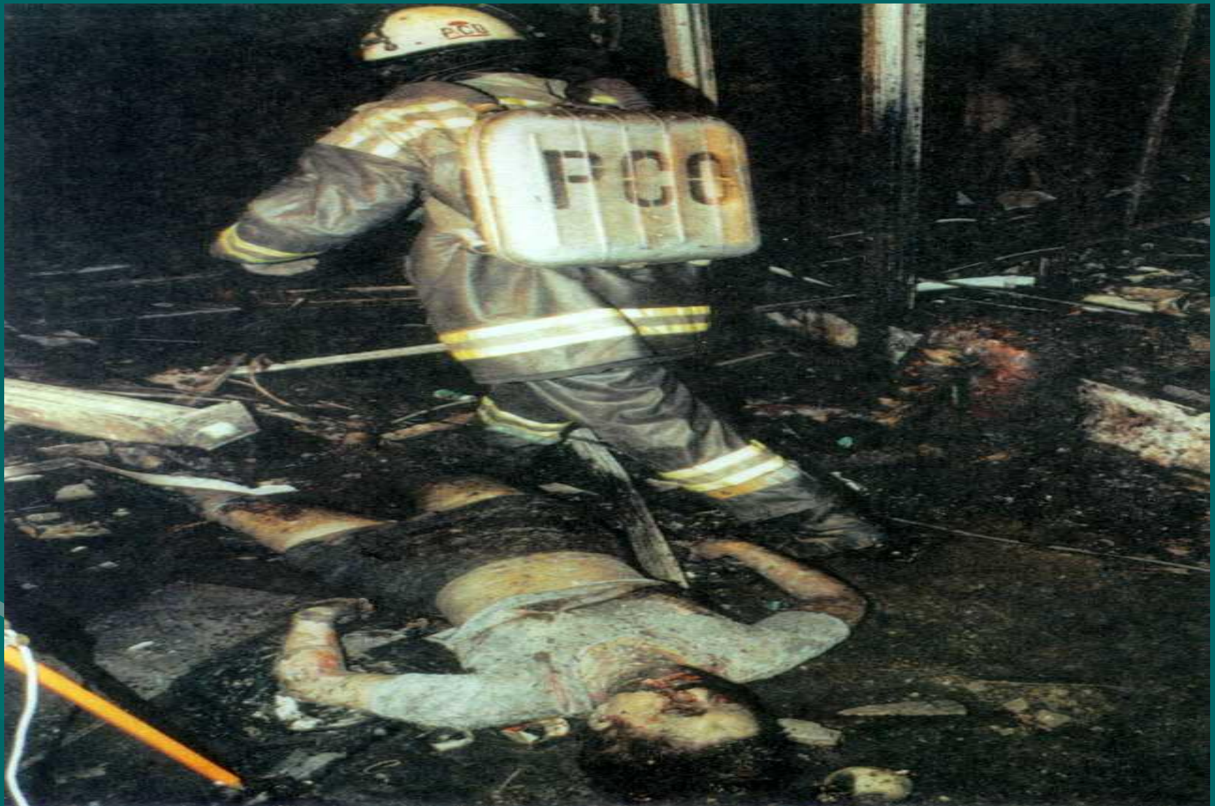
Москва. Пушкинская площадь. Трагедия 8 августа 2000 года