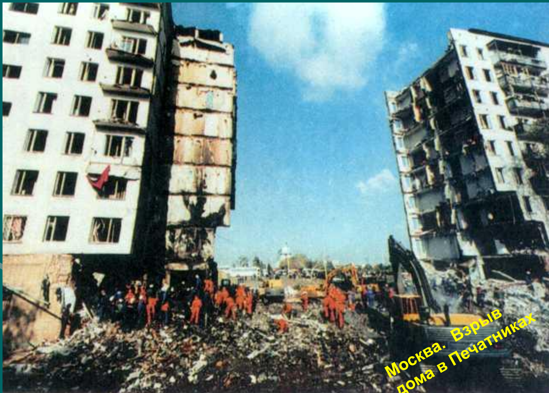
Москва. Взрыв дома в Печатниках