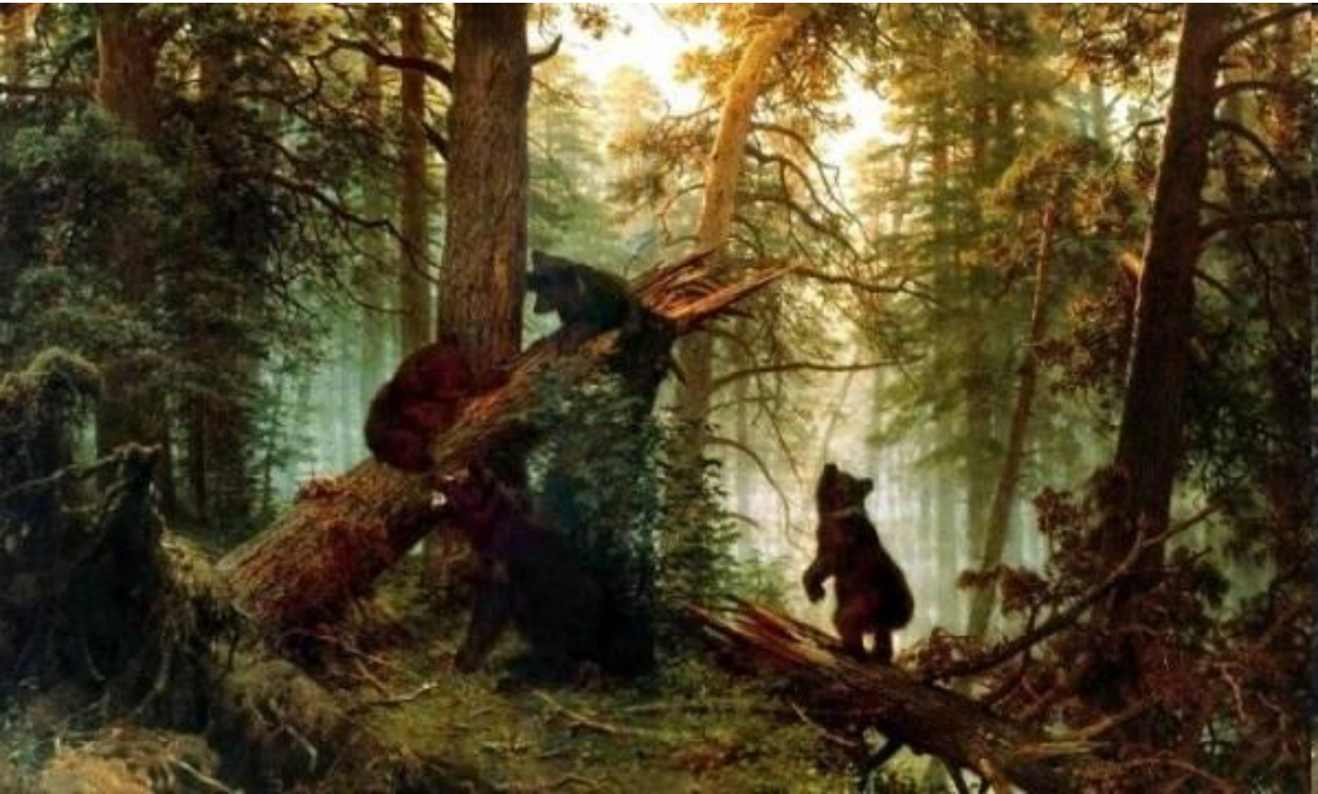
Шишкин «Утро в сосновом бору».