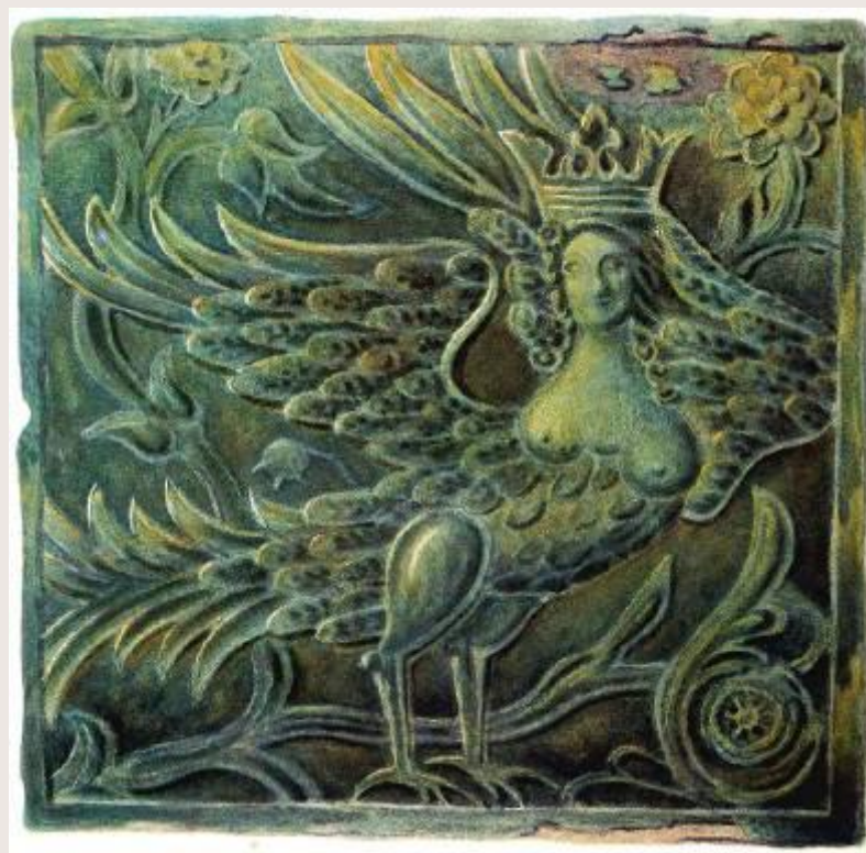
Декор паперти трапезной палаты Борисоглебского монастыря (конец XVII в.)