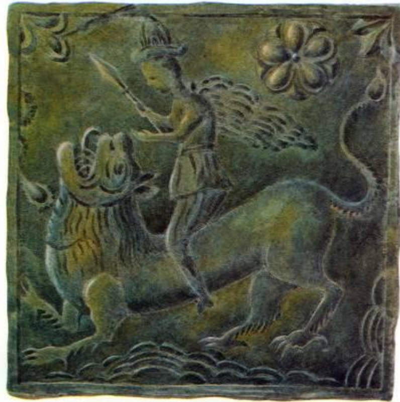
Муравленые изразцы Московского производства в декоре паперти трапезной палаты Борисоглебского монастыря. 90-е годы 17 в.