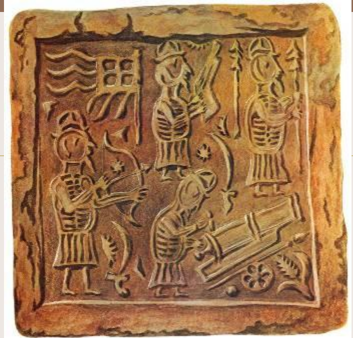
Красный широкорамочный изразец (16 - 17 вв.)