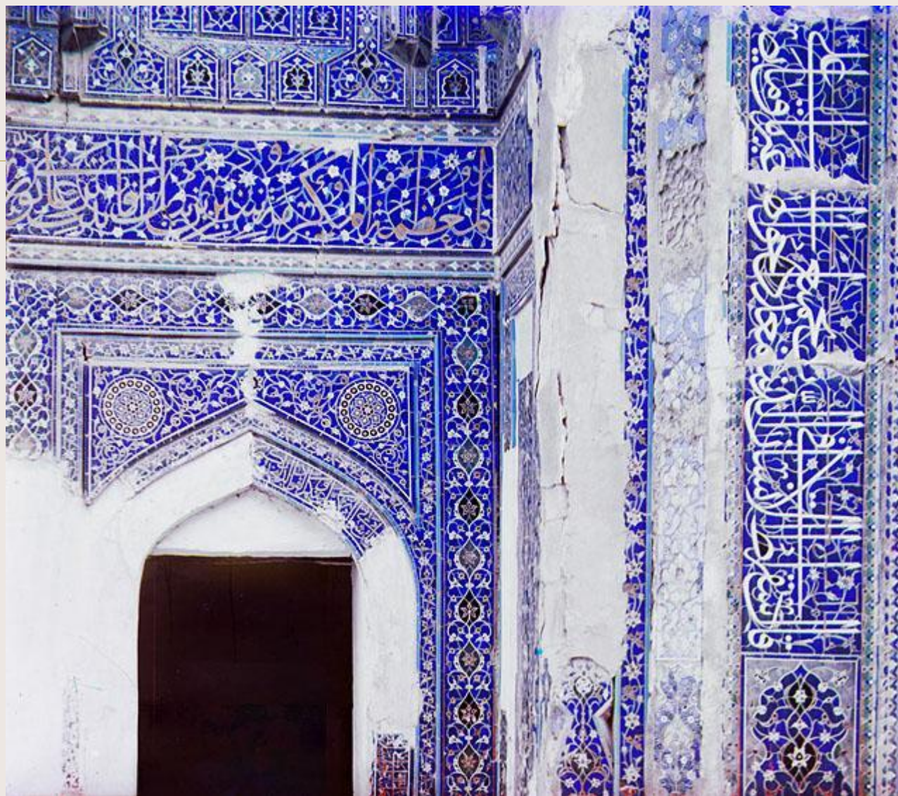
Образцы мозаичных стен в Шах-Зинде. Самарканд. (1905 - 1915 гг.)