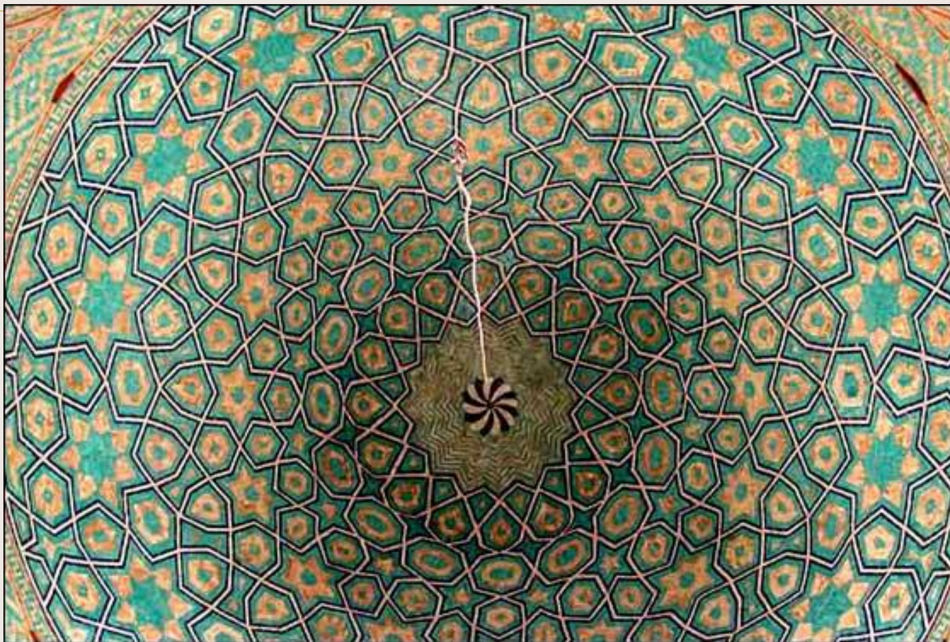
Изразцы соборной мечети в Йазде