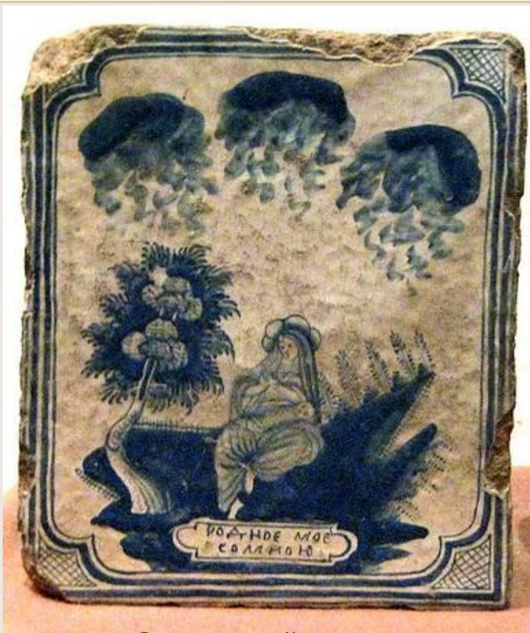
Старинный изразец из Кирилло-Белозерского монастыря