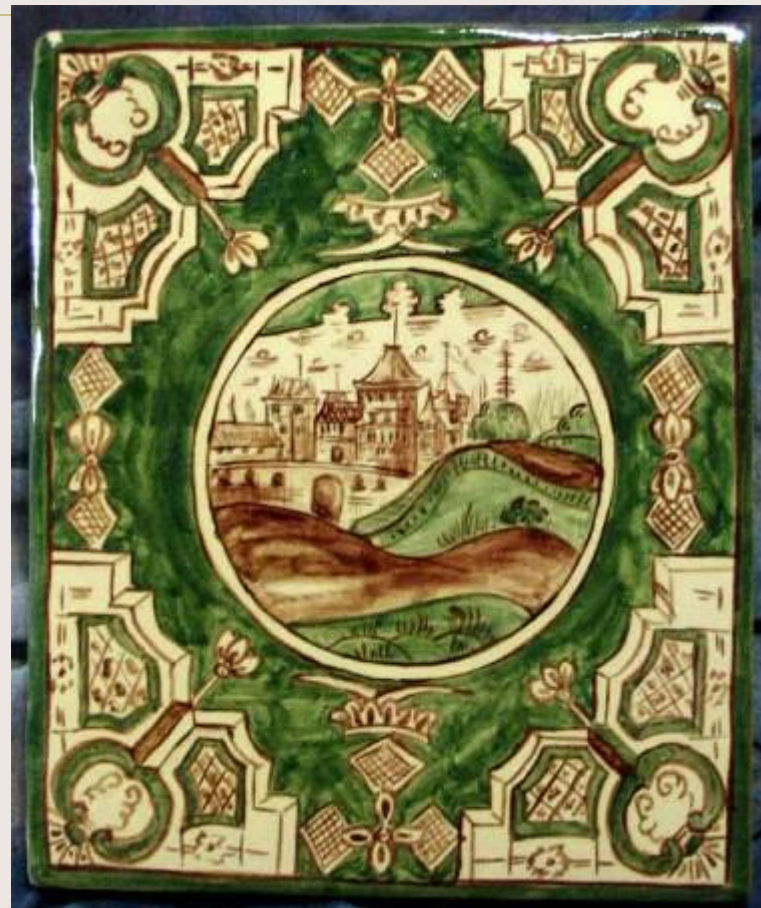
Копии расписных изразцов XIX века