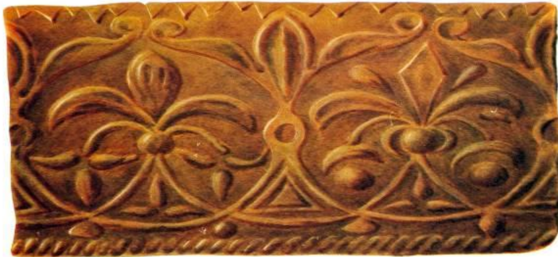
Терракотовая плита в поясе Рождественского собора Ферапонтова монастыря. 1491г.