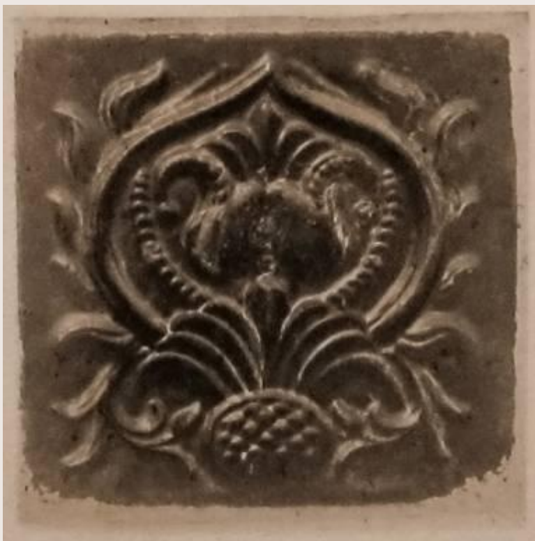
Церковь Воскресения Христова в Ростове (конец XVII в.)

муравленными - назывались изразцы, покрытые зеленой глазурью.