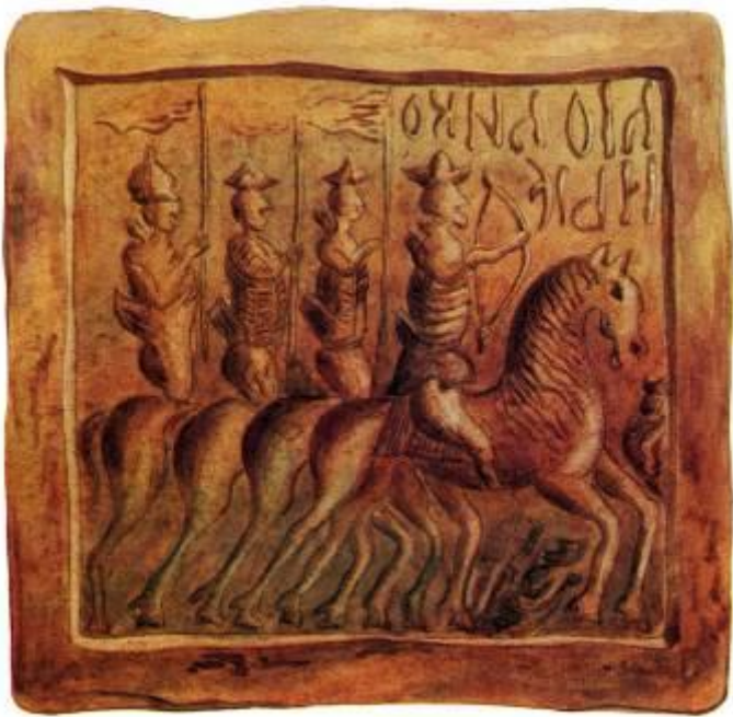
Красные широкорамочный изразец. Церковь Николы Мокрого в Ярославле. 1665-1672