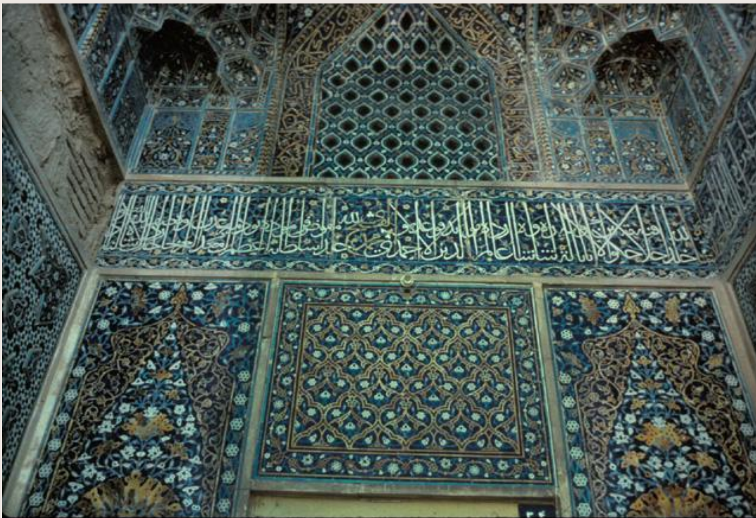
Мечеть Дарб-и Имам Исфахан, Иран.