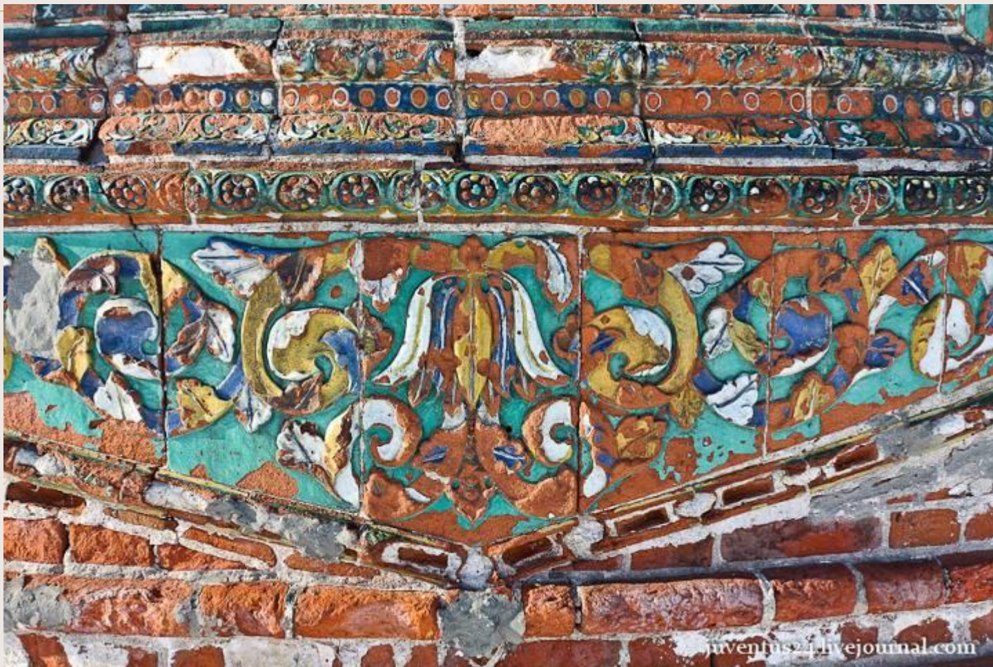
Церковь Иоанна Златоуста (1649 по 1654 г.г.), в Коровниках. Ярославль.