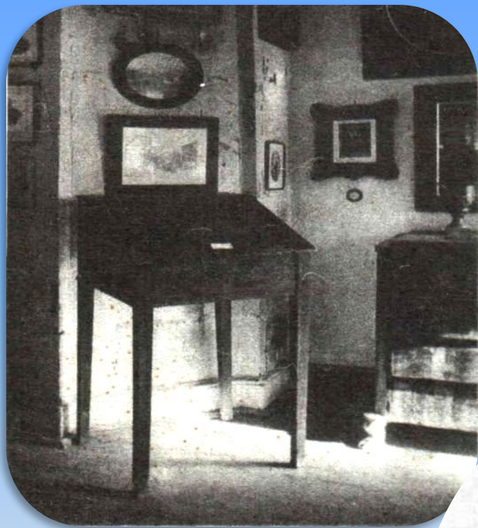
Бюро А.С. Пушкина

И мысли в голове волнуются в отваге, И рифмы лёгкие навстречу им бегут, И пальцы просятся к перу, перо – к бумаге Минута – и стихи свободно потекут.