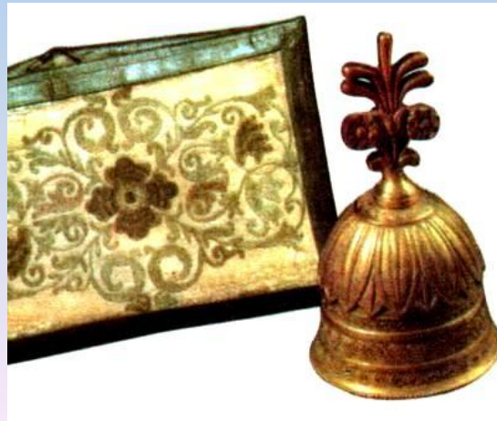
Бумажник и бронзовый колокольчик