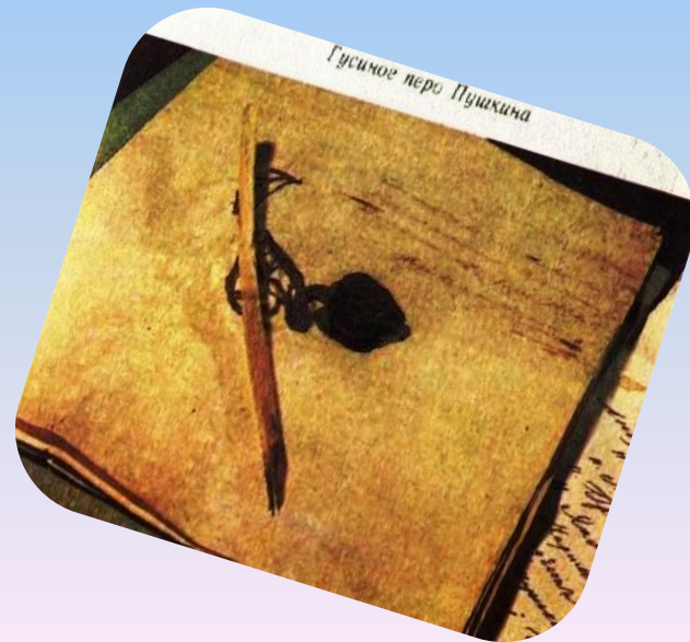
Гусиное перо Пушкина