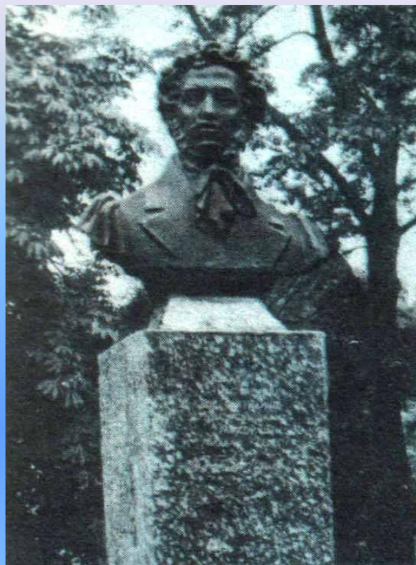
Владикавказ. Республика Алания