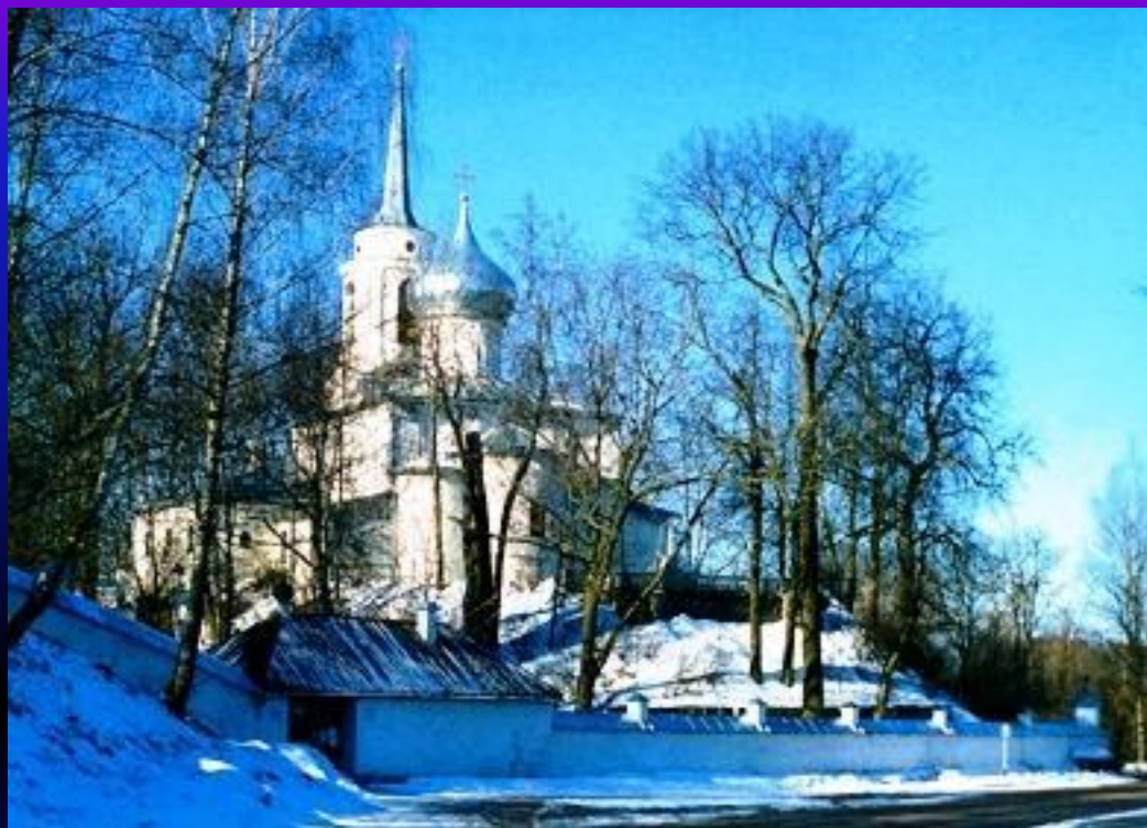
Святогорский Успенский монастырь