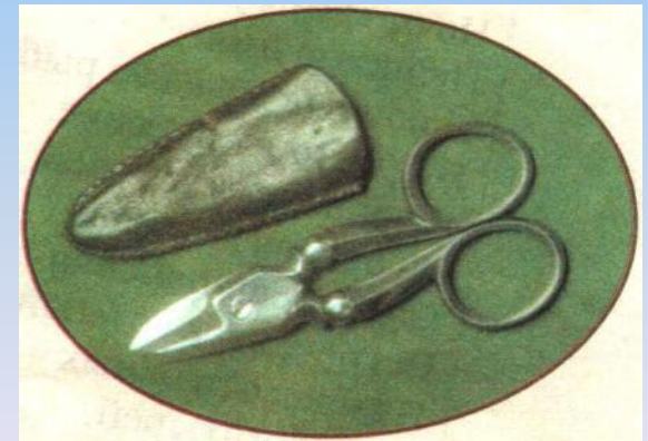
Ножницы и кожаный футляр