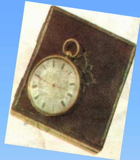
Карманные часы поэта