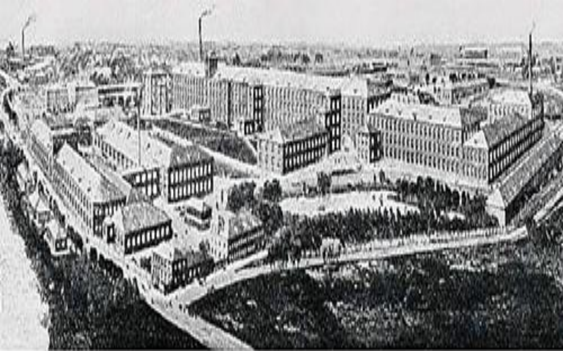
Видъ фабрикъ Т-ва М-ръ П. М. Рябушинскаго съ С-ми.