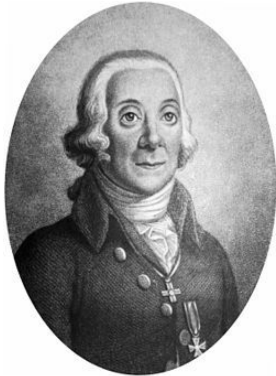
Петер Симон (Пётр-Симон) Паллас (1741—1811)

Пётр Симон Паллас выполнил географическое описание Таманского полуострова.