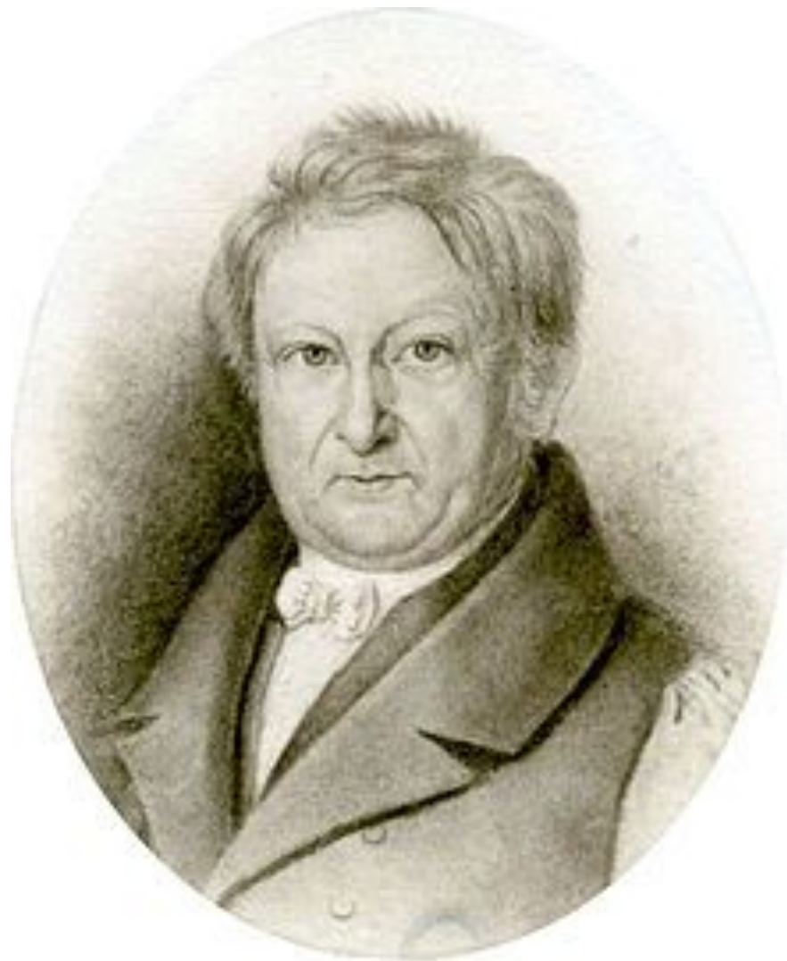
Гейслер Кристиан Готлиб Генрих (1770-1844)

Христиан Готлиб Генрих Гейслер выполнил рисунки черкесов разных сословий