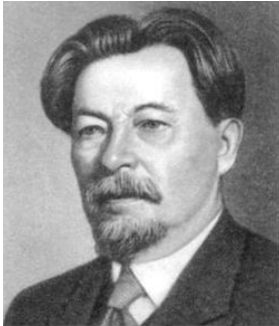
Вячеслав Яковлевич Шишков (1873—1945)

В.Я. Шишков. Роман «Емельян Пугачёв» в которой собраны материалы допроса, рассказывавшие о появлении на Кубани казаков некрасовцев.