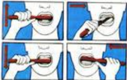
Как надо чистить зубы.