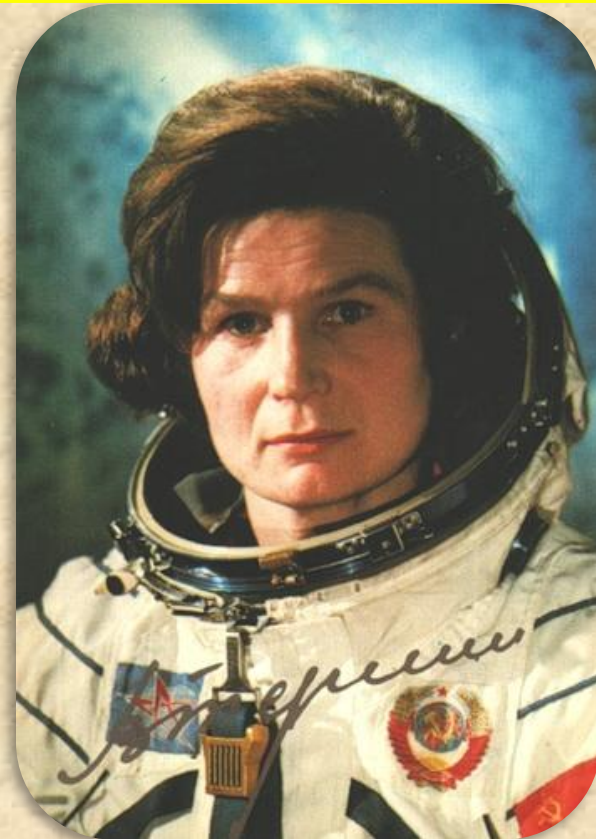
Валентина Владимировна Терешкова