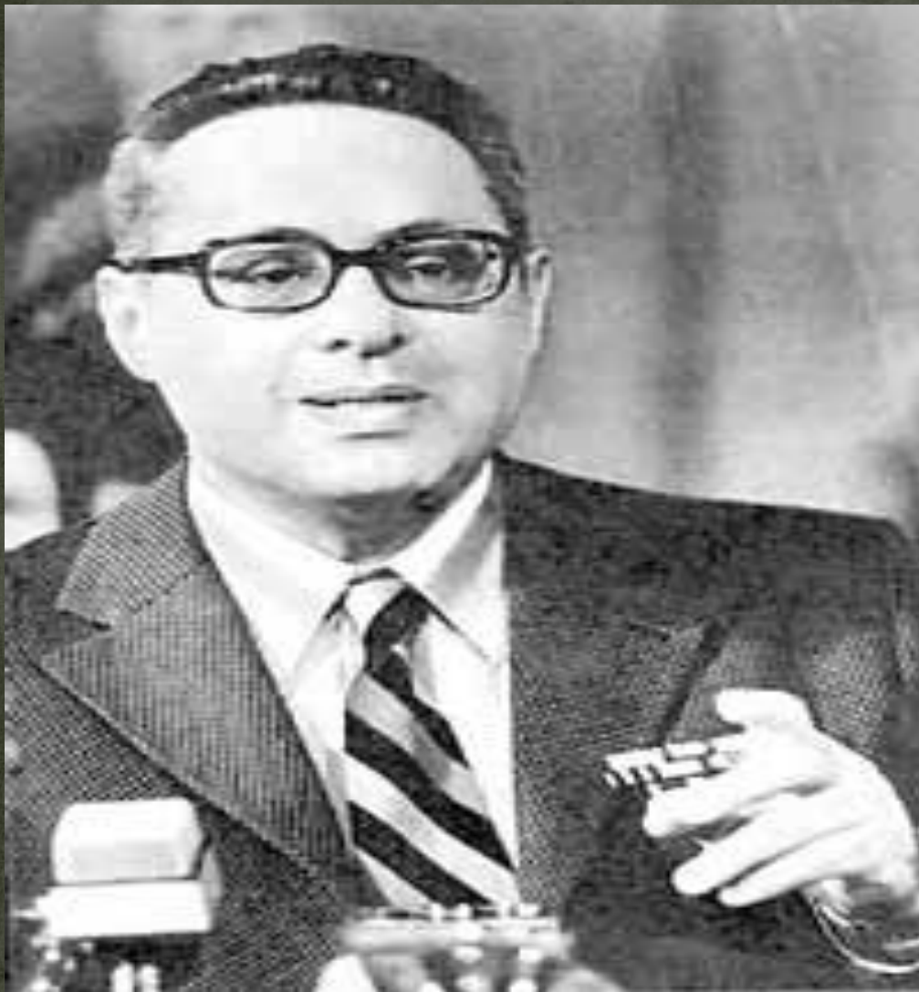
Юрий Борисович Левитан