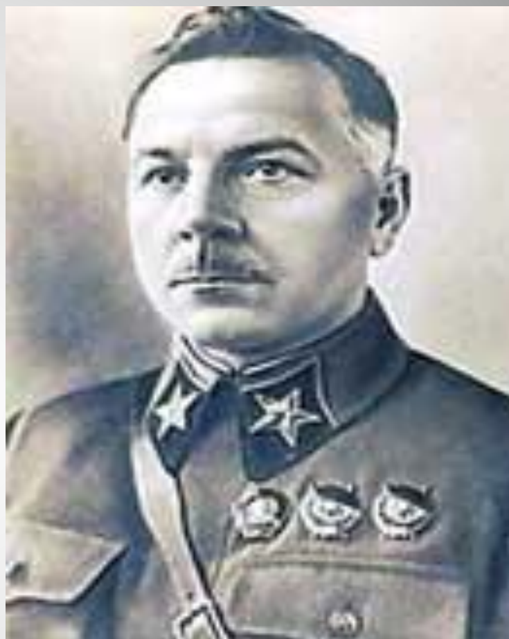
Климент Ефремович Ворошилов