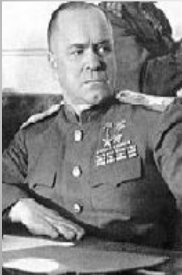
Георгий Константинович Жуков