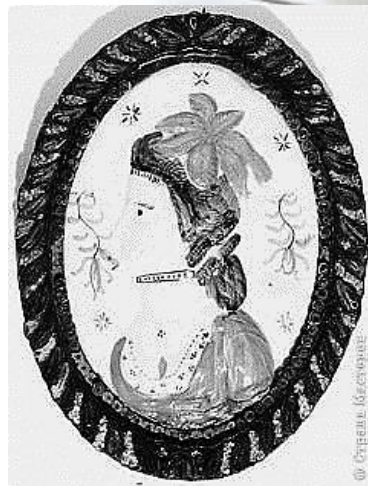
Портрет Маркизы де Сада