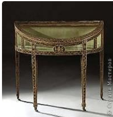
Кабинет времён Георга Третьего резьба-это квиллинг