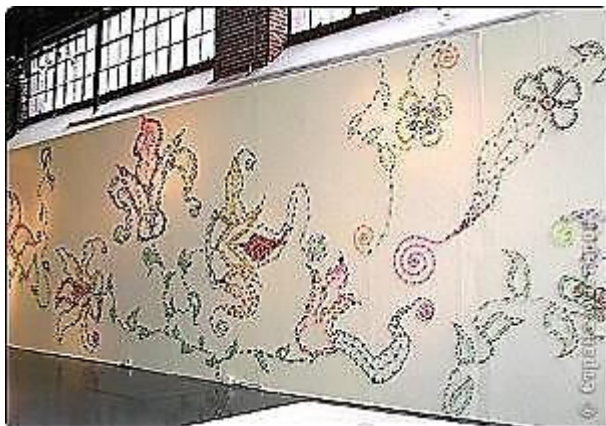
Стена оформленная в квиллинге в музее Сан-Франциско