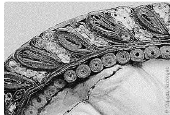
рамка из квиллинга