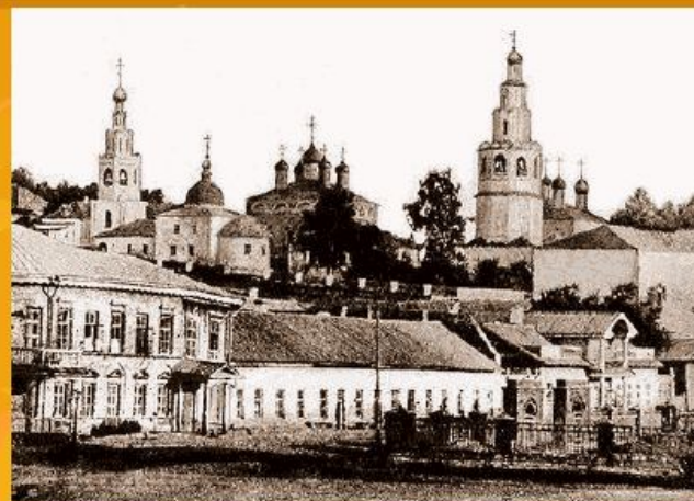
Чебоксары 19 век