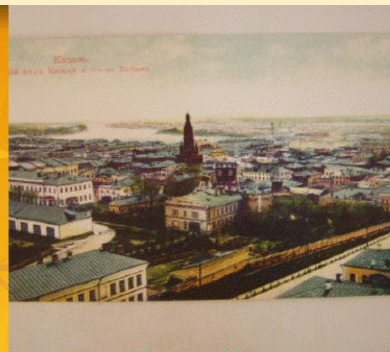
Казань 19 век