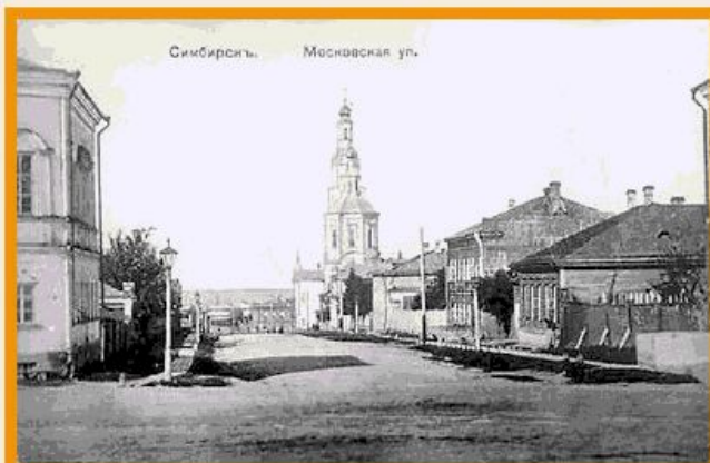
Симбирск. Московская улица.