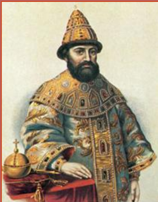
Михаил Федорович (1596-1645)