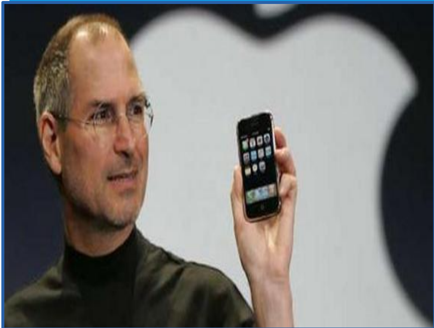
Стивен Пол Джобс (24.02.1955 – 5. 10. 2011)

«Нет такого понятия, как успешный человек, который ни разу не оступился и не допустил ошибки. Есть только успешные люди, которые допустили ошибки, но затем изменили свои планы, основываясь на этих самых ошибках. Я как раз один из таких парней»