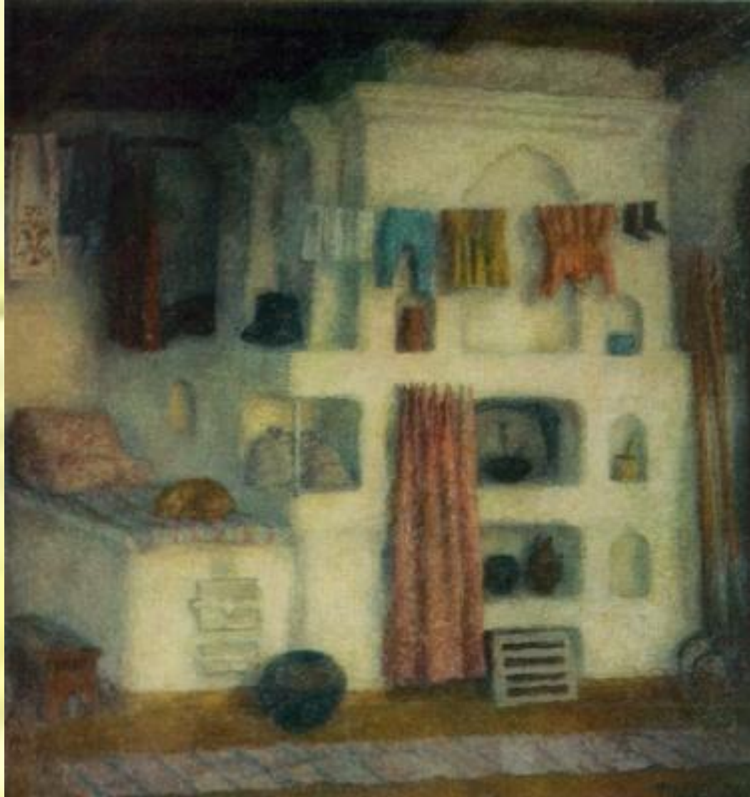
Старая теплая печь