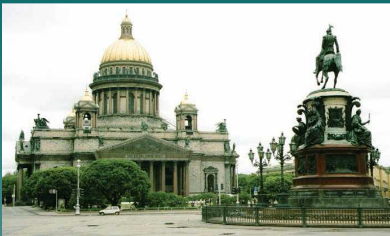
Исторический центр Санкт-Петербурга

Российские культурные объекты, вошедшие в Список всемирного наследия ЮНЕСКО, включают такие признанные памятники истории и архитектуры, как: