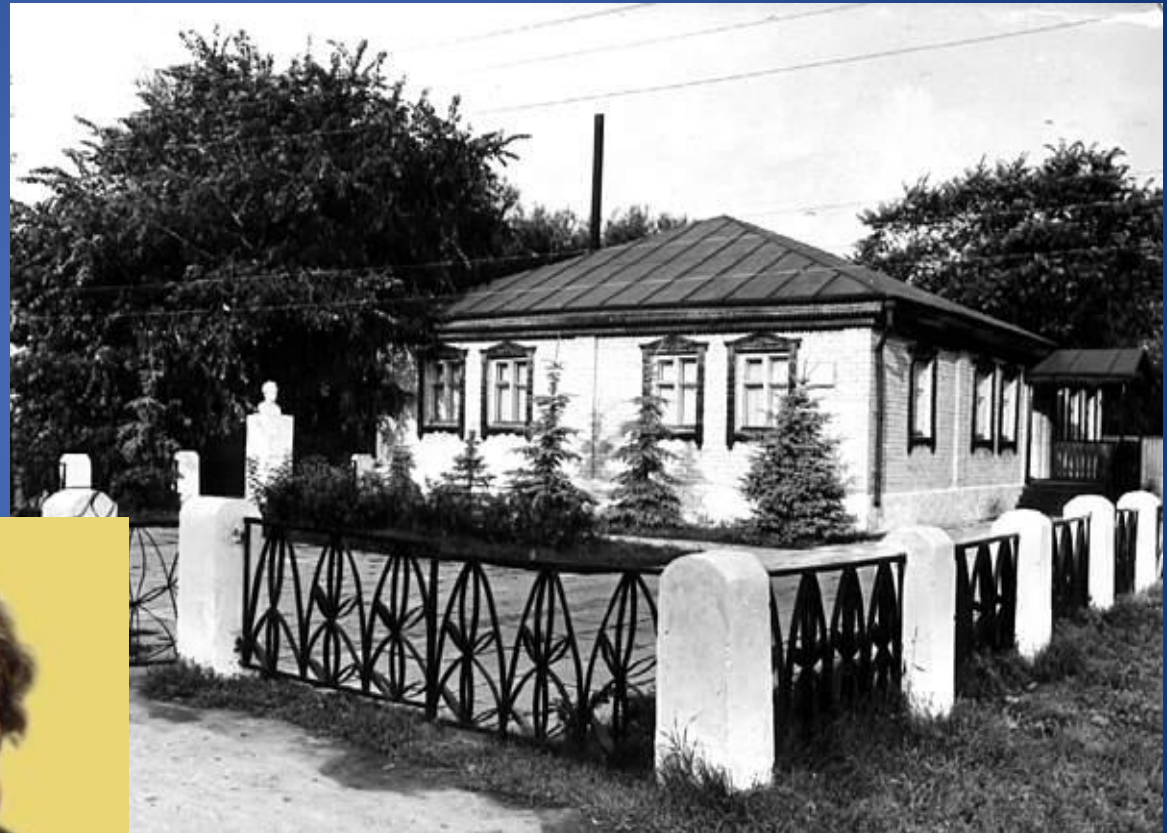
Дом-музей М.Е. Пятницкого