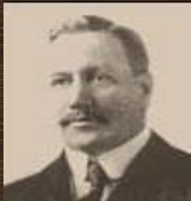
Уильям Дж. Морган