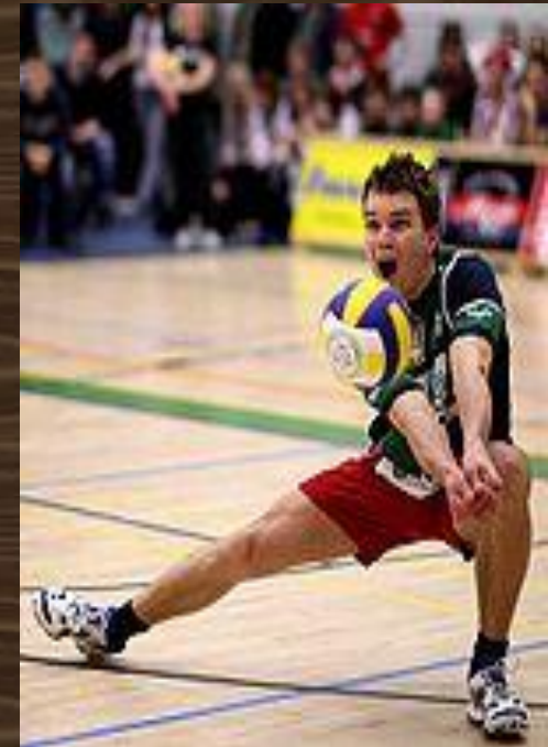
Приём мяча снизу

Обычно принимают мяч игроки, стоящие на задней линии, то есть в 5-й, 6-й, 1-й зонах. Однако принять подачу может любой игрок. Игрокам принимающей команды разрешается сделать три касания и максимум после третьего касания перевести мяч на половину противника. При приёме не допускается никакая задержка мяча при его обработке, хотя принимать мяч можно любой частью тела. Планирующую подачу — могут принимать 2 игрока на задней линии, но для приёма сидевой подачи